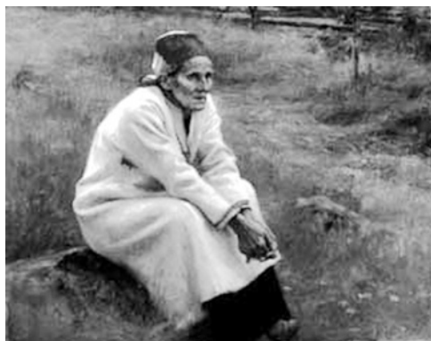
Рис. 15. Ларин Параске. Альберт Эдельфельт. 1893. Музей искусств г. Хяменлинна, Выборгский фонд.

Берестяные предметы для покоса. XIX в. Финны.