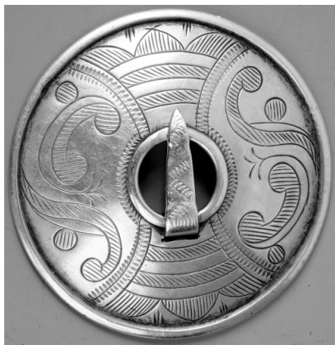
Рис. 13. Пряжка для скрепления ворота женской рубашки. Финны. Карельский перешеек. XIX в. МАЭ. Колл. № 303-51.

всемирно известной «Калевалы» Элиас Леннрот. Первыми знаменитыми собирателями в 1840-е годы были Даниэль Эуропеус и Х.А. Рейнхольм. Мало кто знает, что некоторые из собранных ими ингерманландских сюжетов вошли в «Калевалу». Стипендиаты Общества финской литературы продолжили работу в 1850–1860-х годах. Армасу Лаунису и А.О. Вайсянену удалось записать ингерманландские песни на фонограф. Первая запись на восковом цилиндре была сделана в 1906 г.