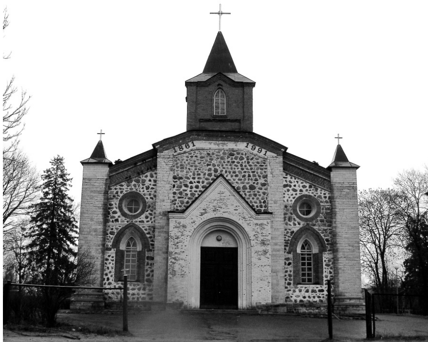
Рис. 21. Лютеранская церковь прихода Купанитса. 2003 г.

Богослужение в развалинах Скворицкой лютеранской церкви. 1999 г.