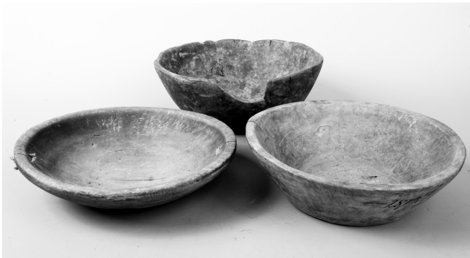
Рис. 11. Миски деревянные. Финны. Карельский перешеек. XIX в. Дерево. МАЭ. Колл. № 287-14.

больших камней, скрепленных гашеной известью и мелкими, порой разноцветными камушками! Сенные сараи, бани и погреба ставились отдельно, а риги, где сушили и обмолачивали хлеб, часто выносили за пределы деревни.