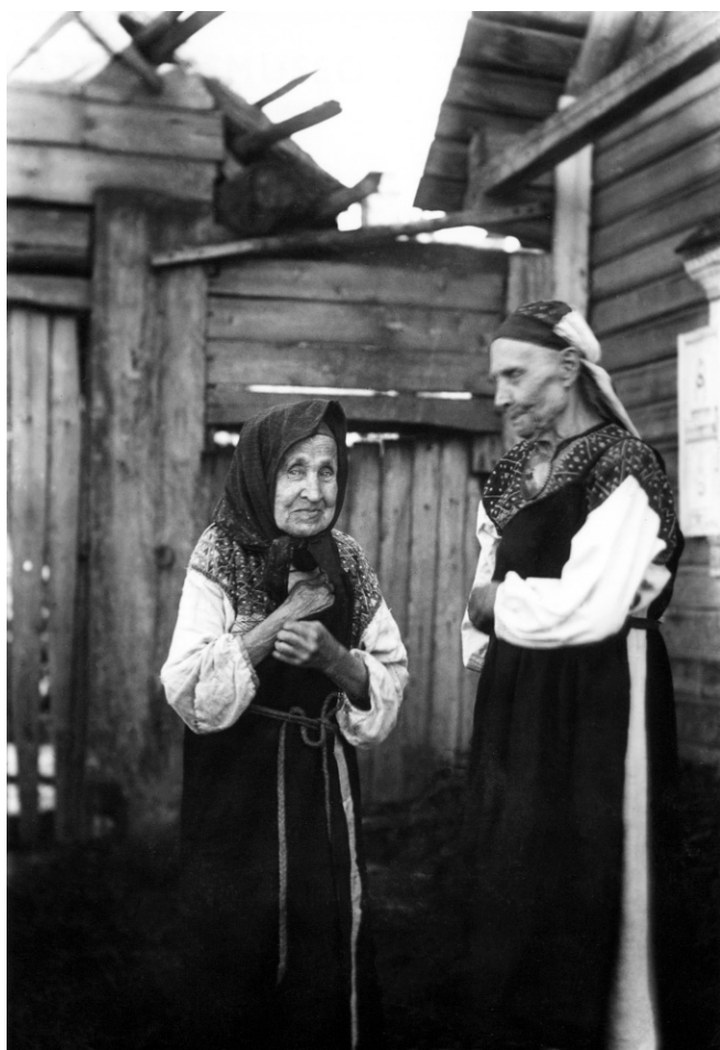
Рис. 3. Пожилые ижорские женщины. 1911.

Финны-эурямейсет и финны-савакот. Сер. XIX в.