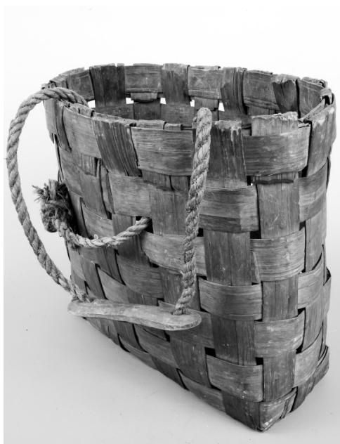
Рис. 9. Корзина плетеная. Финны. Карельский перешеек. XIX в. Щепа. МАЭ. Колл. № 303-36.

Деревня Вяяскюля. Фото Самули Паулахарью, 1911. Музейное ведомство Финляндии.