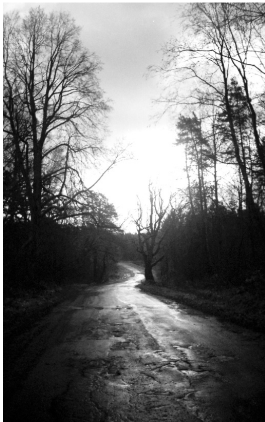
Рис. 29. Водская дорога. Фото О. Коньковой. 2000 г.

Старая пустынная водская дорога. Автор О. Конькова.