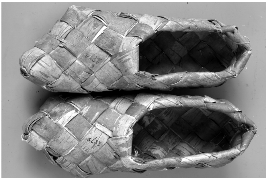
Рис. 24. Ступни. Финны. Карельский перешеек. XIX в. Береста. МАЭ. Колл. № 287-11.