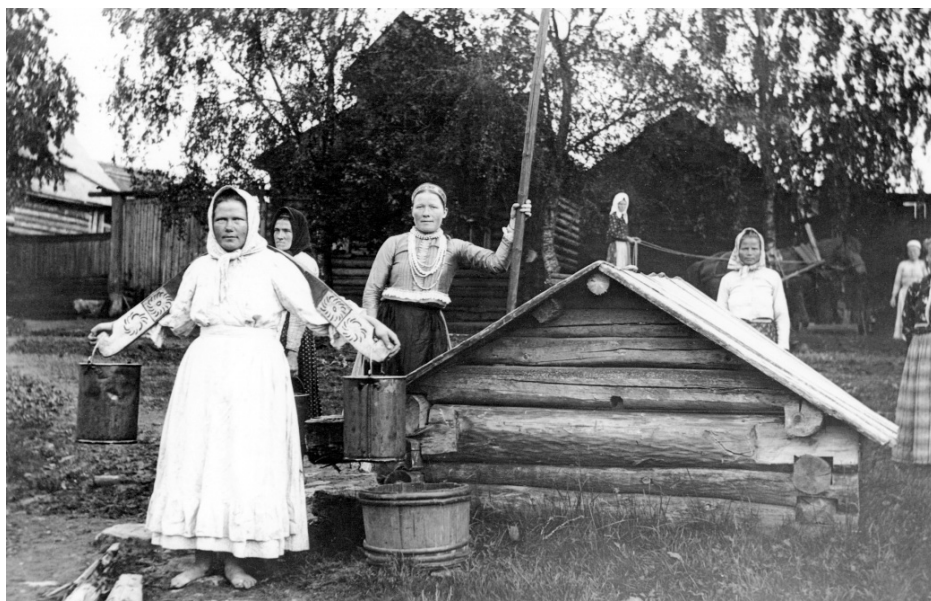
Рис. 6. Финские девушки-савакот прихода Марккова у колодца. Фото С. Паулахарью. 1911. Музейное Ведомство Финляндии.

Витрина 1 Девичий праздничный костюм о-ва Сейскар. XX в. Финны. Костюм замужней женщины, родившей ребенка, из прихода Каттила. Сер. XIX в. (реконструкция). Водь. Женский костюм прихода Купанитса (Губаницы, совр. Гатчинский район). Конец XIX в. Финны-савакот. Полотенца (лен, шерсть, хлопок). XIX в. Ижоры, финны.