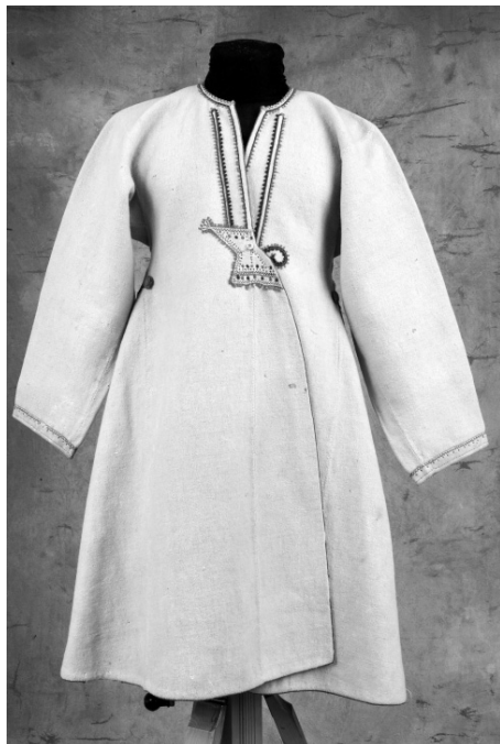
Рис. 17. Женская верхняя одежда. Финны. Карельский перешеек. XIX в. Сукно, вышивка оранжевой, желтой, зеленой шерстью. МАЭ. Колл. № 303-1.