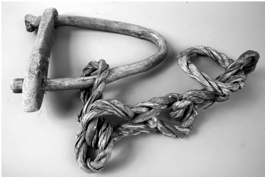
Рис. 20. Ошейник для телят. Финны. Карельский перешеек. XIX в. Дерево. МАЭ. Колл. № 287-104.

лы — лес, камень, песок, гравий. Зимой поставляли дрова санным путем, выгружая их у Тучкова моста. Лес сплавляли и плотами.