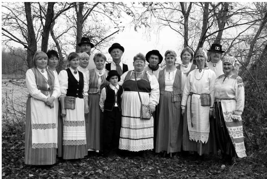
Рис. 28. Фолькгрупа коренных народов «Корпи». 2005 г.

276 человек, а в настоящее время — 172 ижора (по неофициальным данным, ижор сейчас около 1500 чел.). Ижорских школ и газет не существует. Культурная активность ижор поддерживается Ижорским народным музеем в д. Вистино Кингисеппского района и Обществом ижоры и води в Санкт-Петербурге.