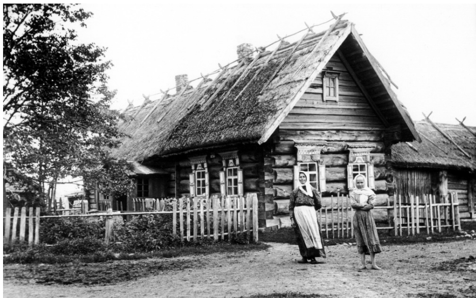
Рис. 7. Деревня Вяясюля. 1911.

Отмена крепостного права (1861 г.) мало изменила жизнь крестьян в Ингерманландии. И хотя столыпинская реформа начала XX в. принесла некоторые улучшения, земельные наделы оставались очень маленькими — не более 6–11 га. Выжить крестьянину помогало рыболовство, охота, соби- рание и продажа грибов и ягод, отхожие промыслы, в Северной Ингерман- ландии — посредническая торговля между Россией и Финляндией.