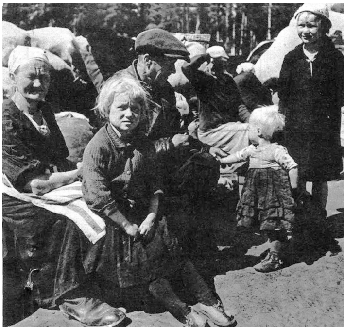
Рис. 25. Ингерманландцы ждут отправки в Эстонию. 1943 г.

По условиям Московского мирного договора 1944 г. Финляндия была обязана возвратить советских граждан. Но 55 000 вернувшихся ингерманландских финнов, ижор и води в Ингерманландию не пустили. Эшелоны везли их в разоренные войной области Центральной России: Псковскую, Новгородскую, Калининскую, Ярославскую и Великолуцкую. Но люди бежали из мест высылки домой. И тогда в 1945 г. дома ингерманландцев в родных деревнях были проданы новым владельцам. А в 1947 г. был введен официальный запрет на проживание финнов в Ленинграде и Ленинградской области.