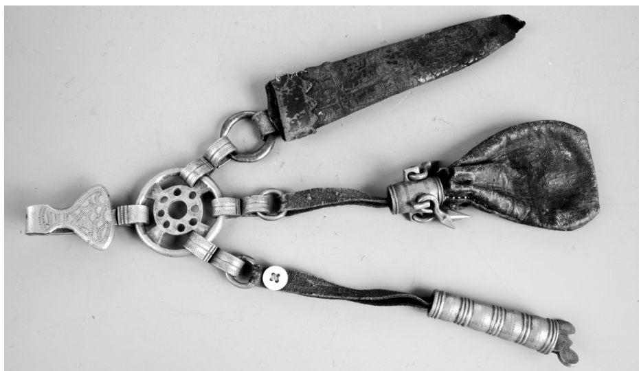
Рис. 18. Подвеска к поясу. Финны. Карельский перешеек. XIX в. Кожа, бронза. МАЭ. Колл. № 314-67.

Большой город — большие проблемы. Строительство города и дорог вело к уничтожению многих старинных финских и ижорских деревень. Поток новых переселенцев вызывал перераспределение земли. Крепостное право, необходимость работать на строительных работах, обслуживание городской жизни — все это изменило традиционный деревенский уклад.