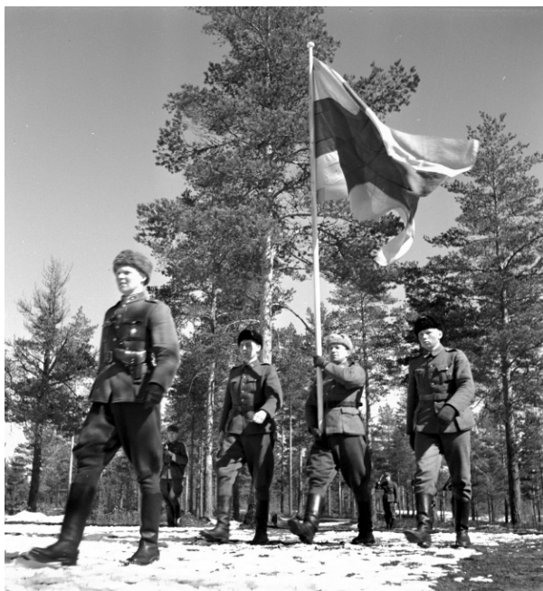
Рис. 23. Североингерманландское ополчение в Кирьясало зимой 1920 г.

Финских учителей готовили в педагогическом техникуме и на финском отделении Педагогического института, журналистов и чиновников — в Коммунистическом университете национальных меньшинств, специалистов сельского хозяйства — в финском сельхозтехникуме. Множество всевозможных курсов и ассоциаций объединил финский Дом народного просвещения в Ленинграде. Был создан финский театр. В 1929 г. в Ленинграде началось радиовещание на финском языке.