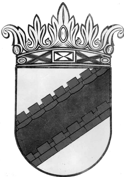
Рис. 26. Герб Ингерманландии.

В годы «социалистической коллективизации» главным местом ссылок были рудники в Хибинах на Кольском полуострове. В 1935–1936 гг. ссылали в Вологодскую область, Южный Казахстан и Среднюю Азию. Начиная с 1937 г. — в Сибирь. Во время войны финнов-мужчин направляли в «трудармию», в основном на оборонные стройки Южного Урала. Депортированные из кольца блокады оказались на просторах Сибири от Оби до Якутии. В Псковской, Великолуцкой, Новгородской, Калининской и Ярославской областях расселили возвращавшихся зимой 1944–1945 гг. из Финляндии. Тогда же в Швецию из Финляндии бежали