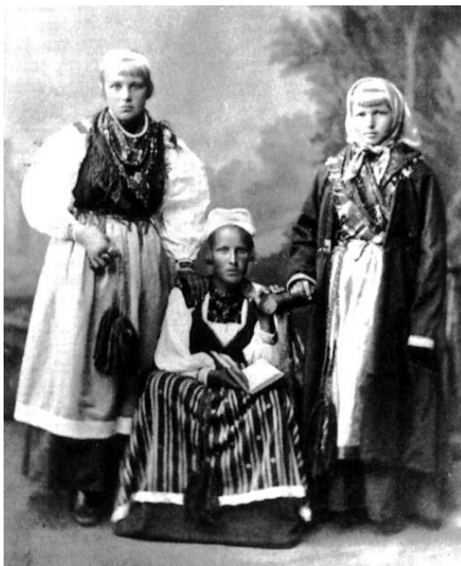
Рис. 4. Финки-зурямёйсет из прихода Тюрё. 1877 г.

Коренными жителями Ингерманландии являются два древних прибалтийско-финских народа — воть и ижора. С IX или с рубежа XI–XII вв. (существуют разные точки зрения) появляются на этой земле славянские племена. По Столбовскому миру 1617 г. Шведское королевство присоединило к себе Ингерманландию. На разоренные русско-шведскими войнами земли стали переселяться финские крестьяне с Карельского перешейка, северных берегов Ладogi и из провинции Саво. На новых землях сформировались две этнические финские группы: савакот и зурямёйсет. К XVIII в. переселившиеся в Ингерманландию финны-лютеране составляли уже более 70 %