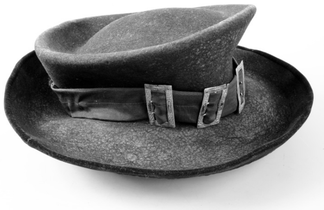
Рис. 14. Шляпа мужская. Финны. Карельский перешеек. XIX в. Фетр. МАЭ. Колл. № 303-23.