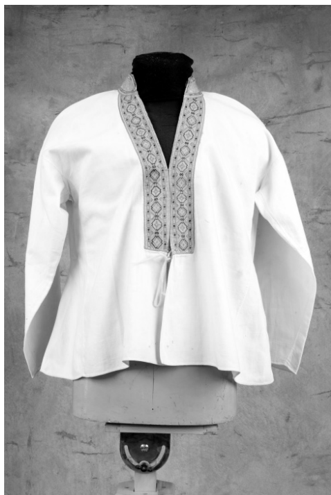
Рис. 5. Кофта женская. Финны. Карельский перешеек. XIX в. Хлопчатобумажное полотно, вышивка оранжевой, желтой, зеленой шерстью. МАЭ. Колл. № 287-135.

Иллюстрации Водская семья Девушки Сойкинского полуострова в национальной одежде. Пожилые ижорские женщины. Водская молодежь. Финские девушки-савакот из прихода Марккова у колодца. Фото Самули Паулахарью, 1911 г. Музейное ведомство Финляндии.