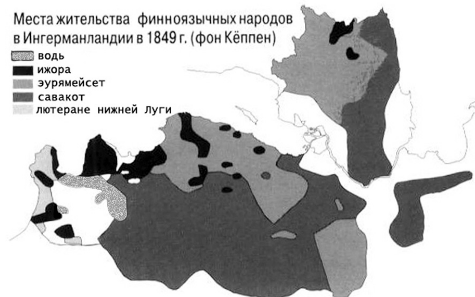
Рис. 1. Карта расселения финноязычных народов Ингерманландии сер. XIX в. (по материалам П. фон Кёппена).

В этом разделе приведем тексты с указанием использованных фотографий, списки сопровождающих коллекционных предметов и пейзажных фотографий. Следует отметить, что особенности экспозиционной площади потребовали размещения витрин с костюмами и текстилем не в соответствии с темами, а в углах зала.