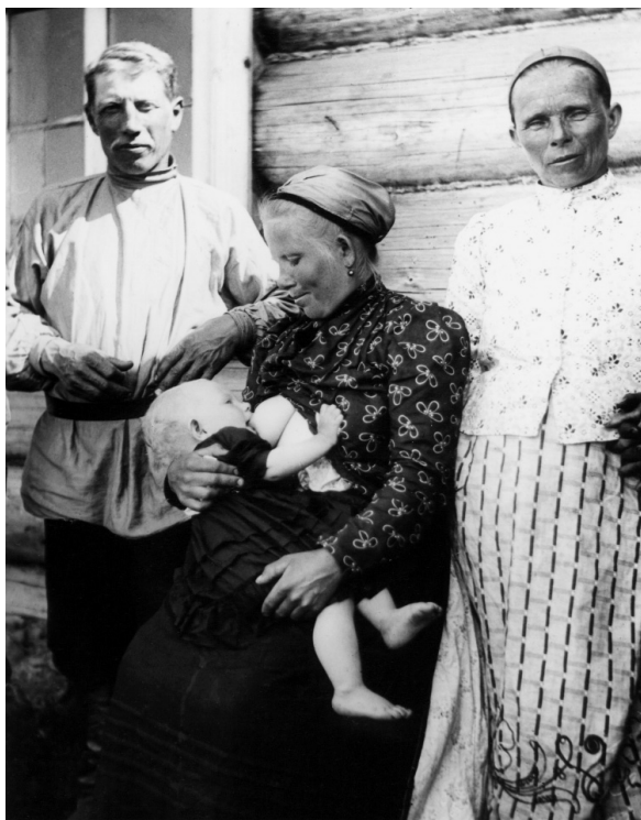
Рис. 2. Водская семья. 1911.

Все последнее тысячелетие Ингерманландия была объектом раздора между Востоком и Западом. За эту землю, расположенную на пересечении важнейших торговых путей, боролись древнее Новгородское государство, Швеция, Дания, Германия, Россия. Борьба шла и между западной католической и восточной православной церковью.