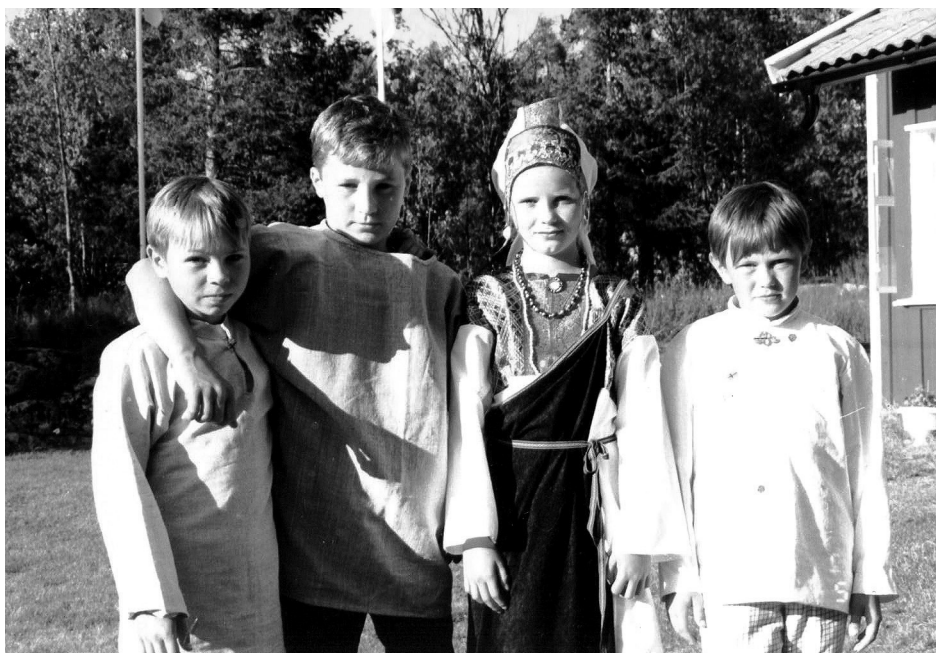
Рис. 27. Дети в ижорской одежде. 1994 г.

Расеяние сопровождалось постепенным обрусением ингерманландских финнов, а в Эстонии — их эстонизацией. Опасаясь за судьбу детей, родители боялись учить их финскому языку, растить в финских традициях. Дети в национально смешанных семьях (а таких становилось все больше) усваивали национальную идентичность большинства. Мер по реабилитации финнов-ингерманландцев, восстановлению их прав на родной язык и культуру власти не предпринимали.