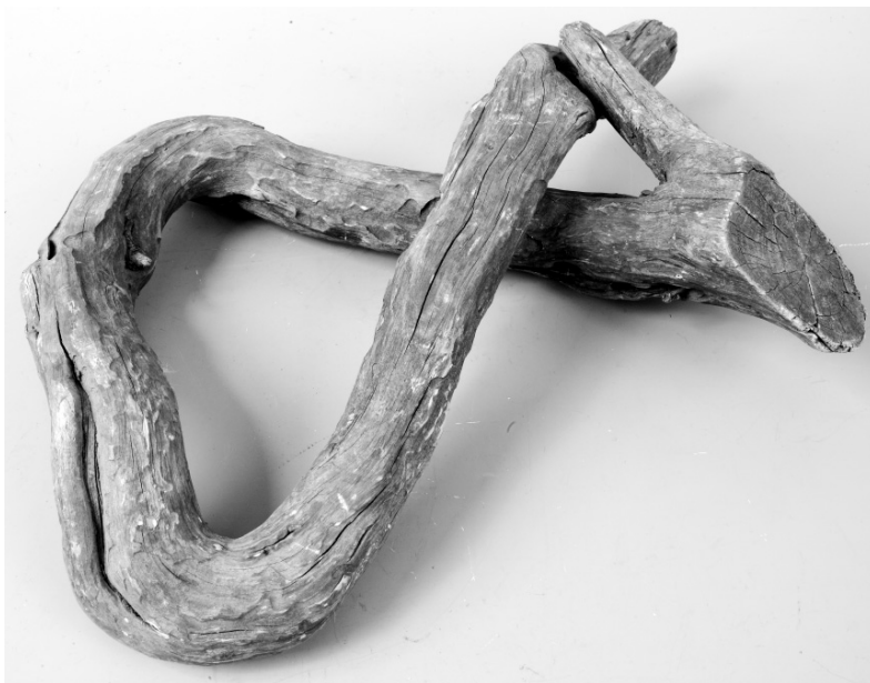
Рис. 12. Вересковый ствол для магических целей. Финны. Карельский перешеек. XIX в. МАЭ. Колл. № 287-127.

Большое количество финских исследователей изучали ингерманландский фольклор. Первым, кто обратил на него внимание, был создатель