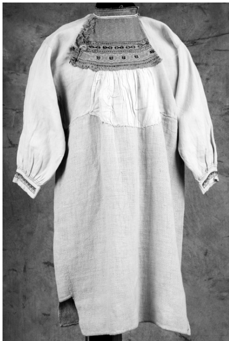
Рис. 16. Рубаха женская. Финны. Карельский перешеек. XIX в. Лен, вышивка оранжевой, желтой, зеленой шерстью. МАЭ. Колл. № 303-50.

Трава, небо, солнце. Автор И. Риехакайнен.