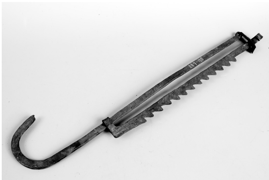
Рис. 10. Крюк для подвешивания котла. Финны. Карельский перешеек. XIX в, железо. МАЭ. Колл. № 287-120.

Деревенская улица. Авторы Т. Быкова, В. Ужвиев.