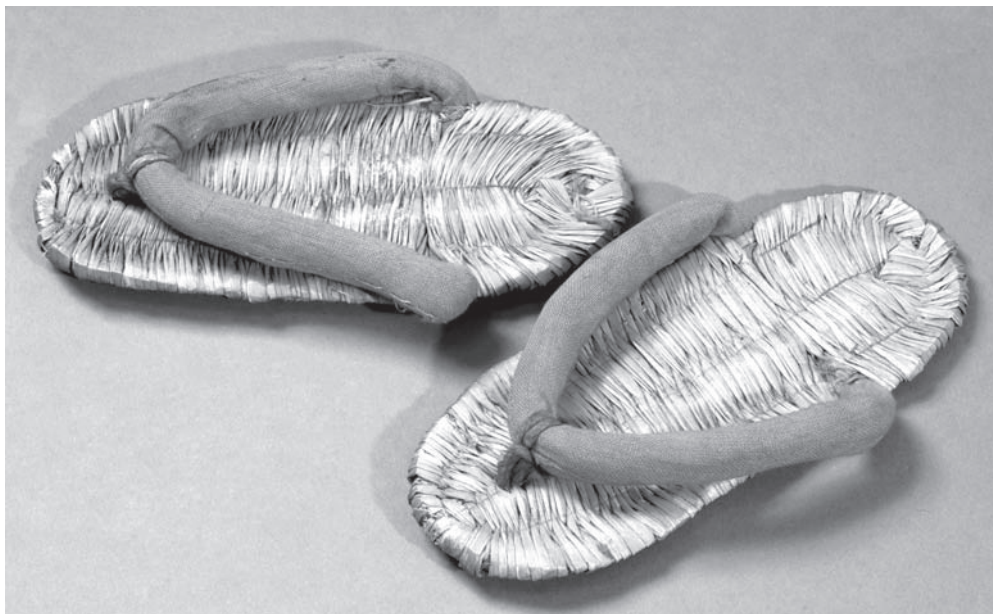
Рис. 1. Детские соломенные сандалии варадзори . МАЭ. Колл. № 4386-9 а, б (см. на CD рис. 1, 1-1)

К варадзори для придания прочности и увеличения срока службы часто подшивали подметку из кожи. Зачастую пяточная часть дополнительно усиливалась металлической накладкой (№ 4386-10 а, б). Также вместо кожаной подметки часто пришивали соломенный или пеньковый жгут, сплетенный «косичкой» и сложенный в четыре раза на подошве с обратной стороны. В пяточной части варадзори на такой жгут часто надевался кусочек кожи (№ 5944-76 а, б, см. на CD рис. 2, 2-1).