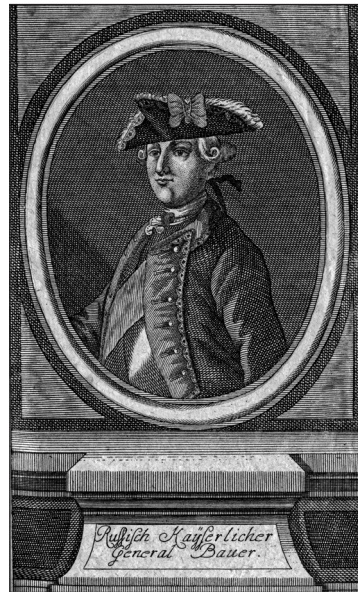
Рис. 1, 2. Репродукции силуэта 1 и портрета 2 Ф.В. Бауера