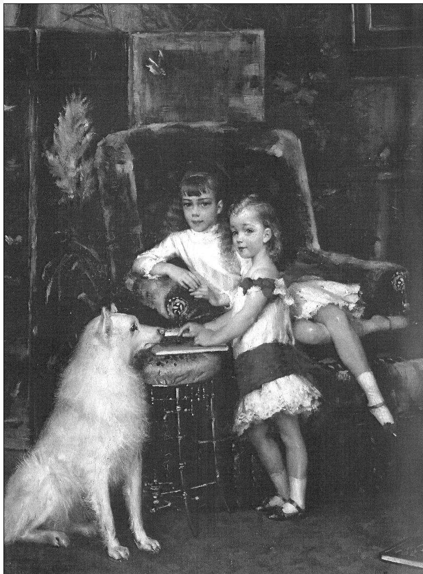
Рис. 1. Дети Александра III