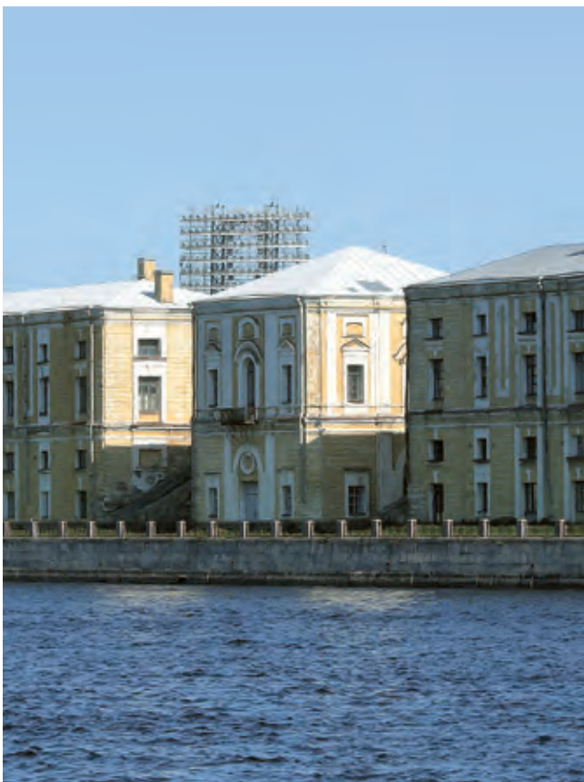
Рис. 31, 32. Тучков буян