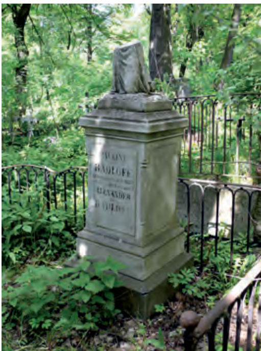
Рис. 3. Могила академика Радлова на Смоленском лютеранском кладбище в Петербурге

культуры) 6 , а также ввести в научный оборот этот термин. Во многом такой подход к исследованию был неразрывно связан с изучением истории развития ведущих европейских этнографических музеев, поэтому промежуточные результаты работы стали важны для полного анализа всех этапов становления идеологии создания как этнографических музеев Европы, так и петербургского Музея антропологии и этнографии. Полученные в ходе исследования материалы в дальнейшем могут быть использованы как самостоятельно, так и для атрибуции музейных коллекций, приобретенных МАЭ в период с 1894 по 1918 г., а также для детальных исследований различных аспектов многогранной деятельности академика В.В. Радлова.