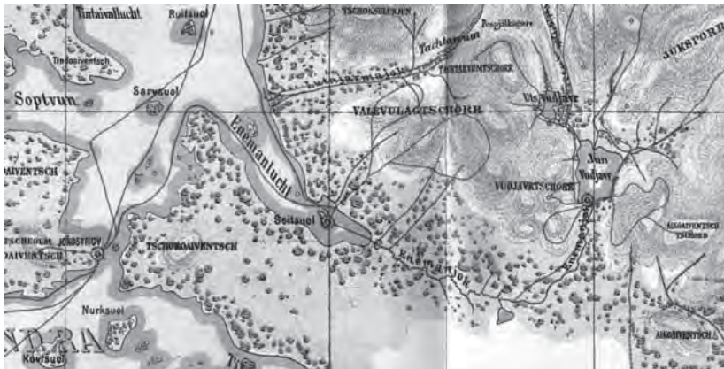
Рис. 1. Фрагмент карты 1891 г., составленной Альфредом Петрелиусом. Губа Белая — Enemanluht; Сейд-остров (откуда «сейд улетел») — Seitsuoel; Большой Вудьявр — Jun Vudjavr; Вудьяврчорр (гора, в расщелине которой «сейд поселился») — Vudjavrtshorh