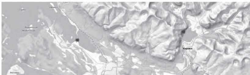
Рис. 2. Современная карта-схема, где звездочкой слева указано место, откуда «сейд улетел», — остров Сейд-суол (сейчас находится на территории хвостохранилища фабрики АНОФ–2); звездочкой справа — место, где «сейд поселился», на скале на берегу озера Большой Вудьявр

Летом 1873 г. путешествуя по Кольскому полуострову писатель В. И. Немирович-Данченко 1 записал следующее предание (по моим сведениям, это первая из известных записей данной легенды):