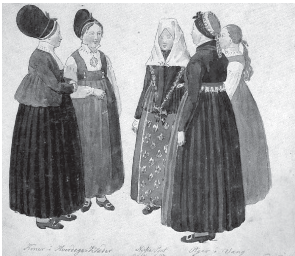
Рис. 24. Норвежки в повседневной одежде начала XIX в. из Ванг, район Валдрес, провинция Оппланд. Акварель норвежского художника Юханнесена Флинто