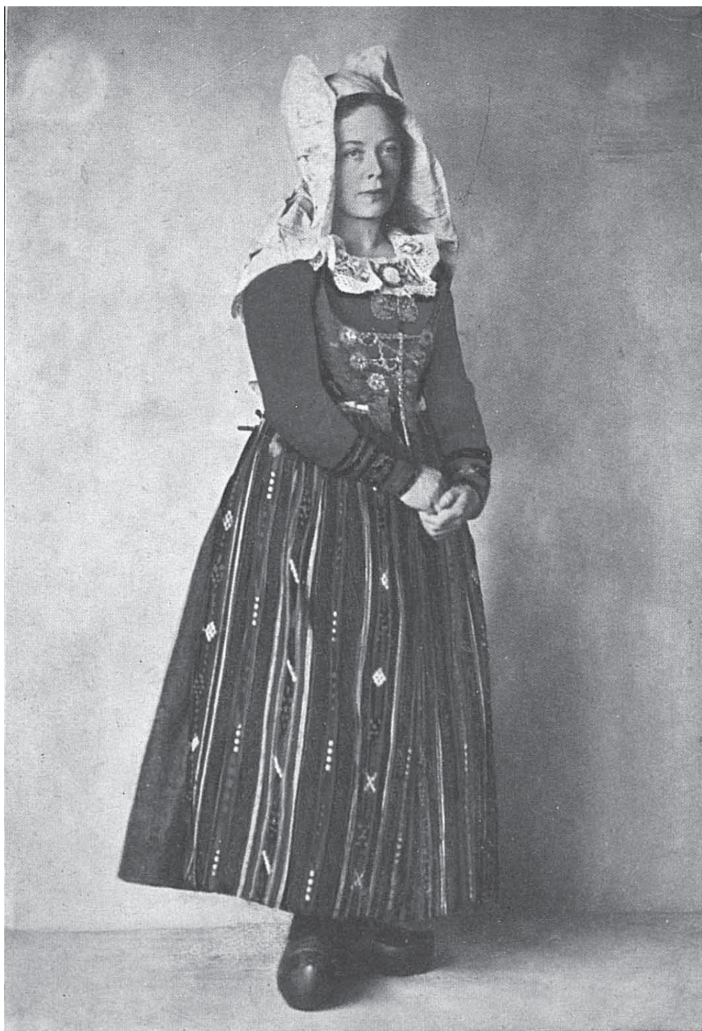
Högtidsdräkt från Vemmenhøgs hd, Skåne. 4280-316. Skansen.