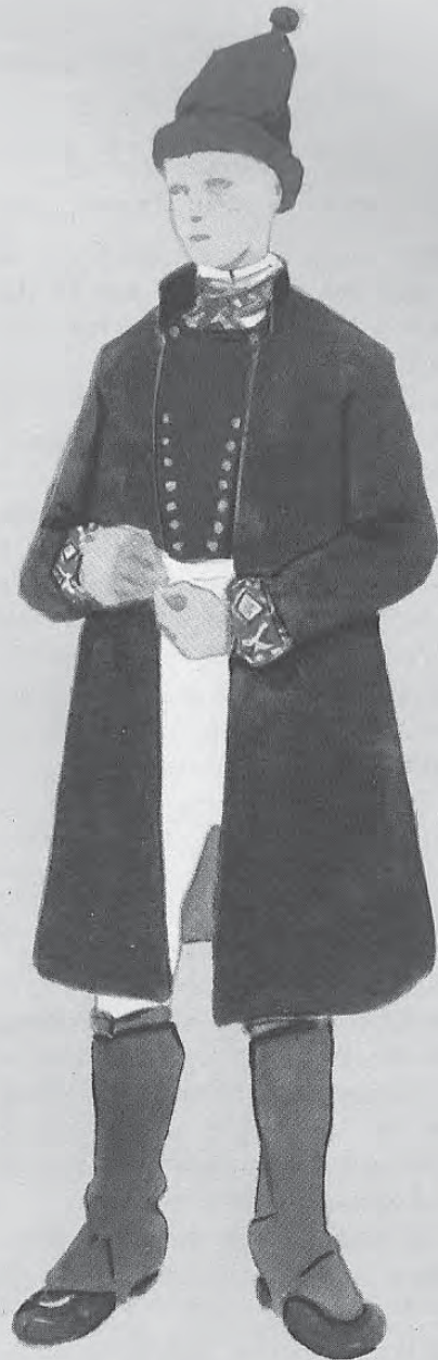
No. 46. Floda