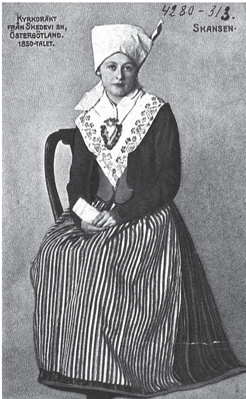
Рис. 19. Женский костюм. Скансен. Эстерготланд. Kyrkdräkt från Skedevis sn. Östergötland. Skansen. МАЭ. Колл. № 4280-313