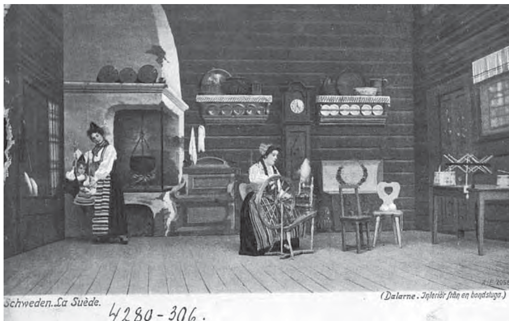
Рис. 14. Внутренность избы. Даларна. Надпись «Schweden. La Suède (Dalarna) Interiör från en bondstuga). МАЭ. Колл. № 4280-306

норвежцев в национальных костюмах района фьорда Гейрангер, исполняющих под звуки норвежской скрипки «фела» народный танец.