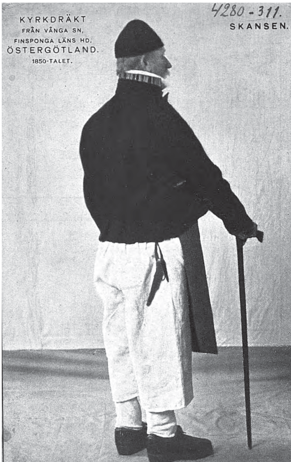
Рис. 21. Мужской костюм (вид сзади). Скансен. Эстерготланд. Kyrkdräkt från Vånga sn. Finspong läns hd. Östergötland, 1850-talet. Skansen. МАЭ. Колл. № 4280-312. Открытка раскрашена