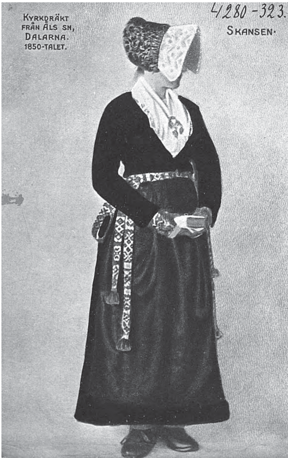
Рис. 18. Женская одежда. Скансен, Даларна. Kyrkläcka från Åls sn. Dalarna. 1850-talet. Skansen. МАЭ. Колл. № 4280-323