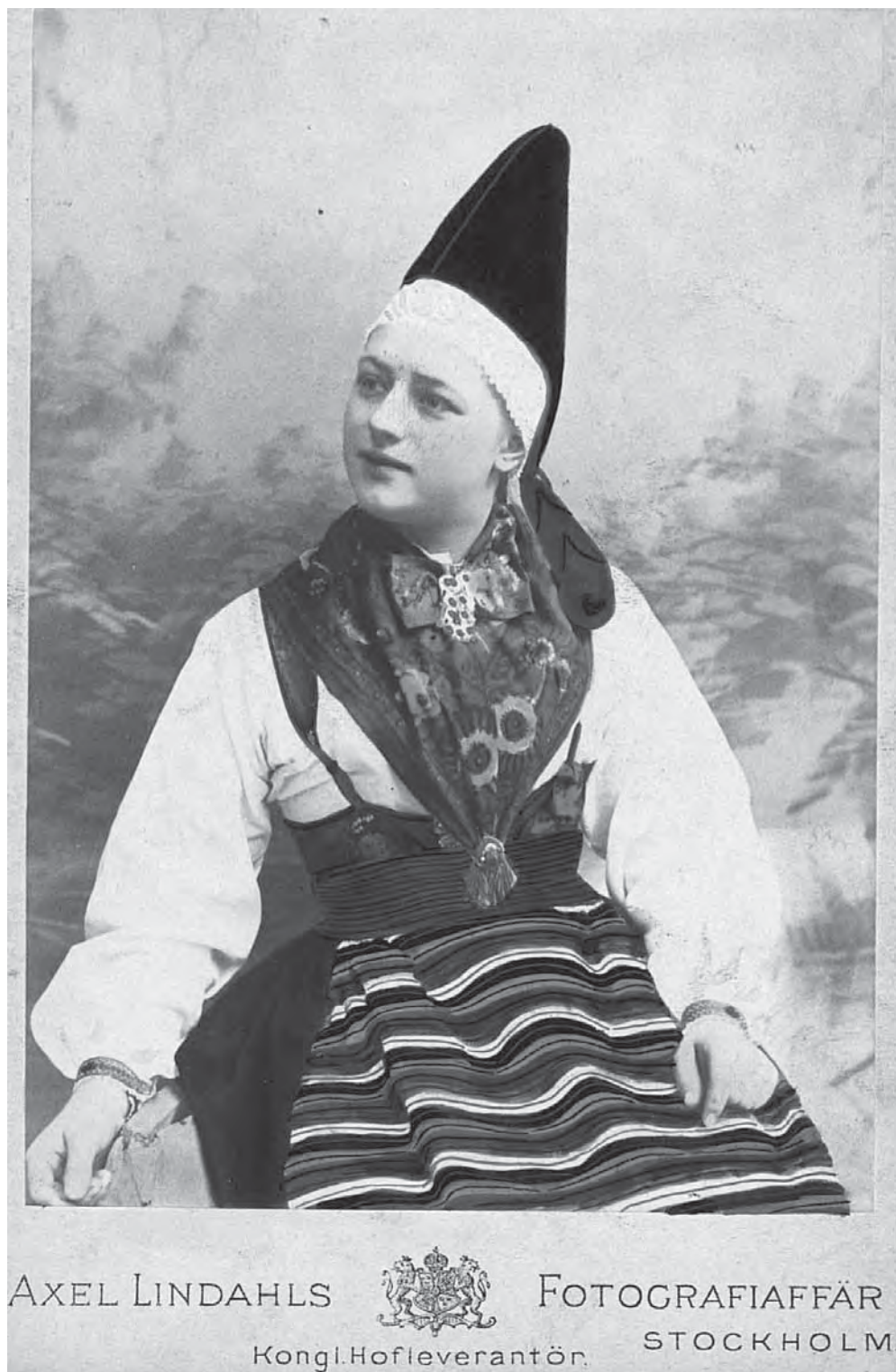
Рис. 3. Женский костюм, м. Rättvik, провинция Далекарлия, Швеция. 1902 г. МАЭ. Колл. № 661-6