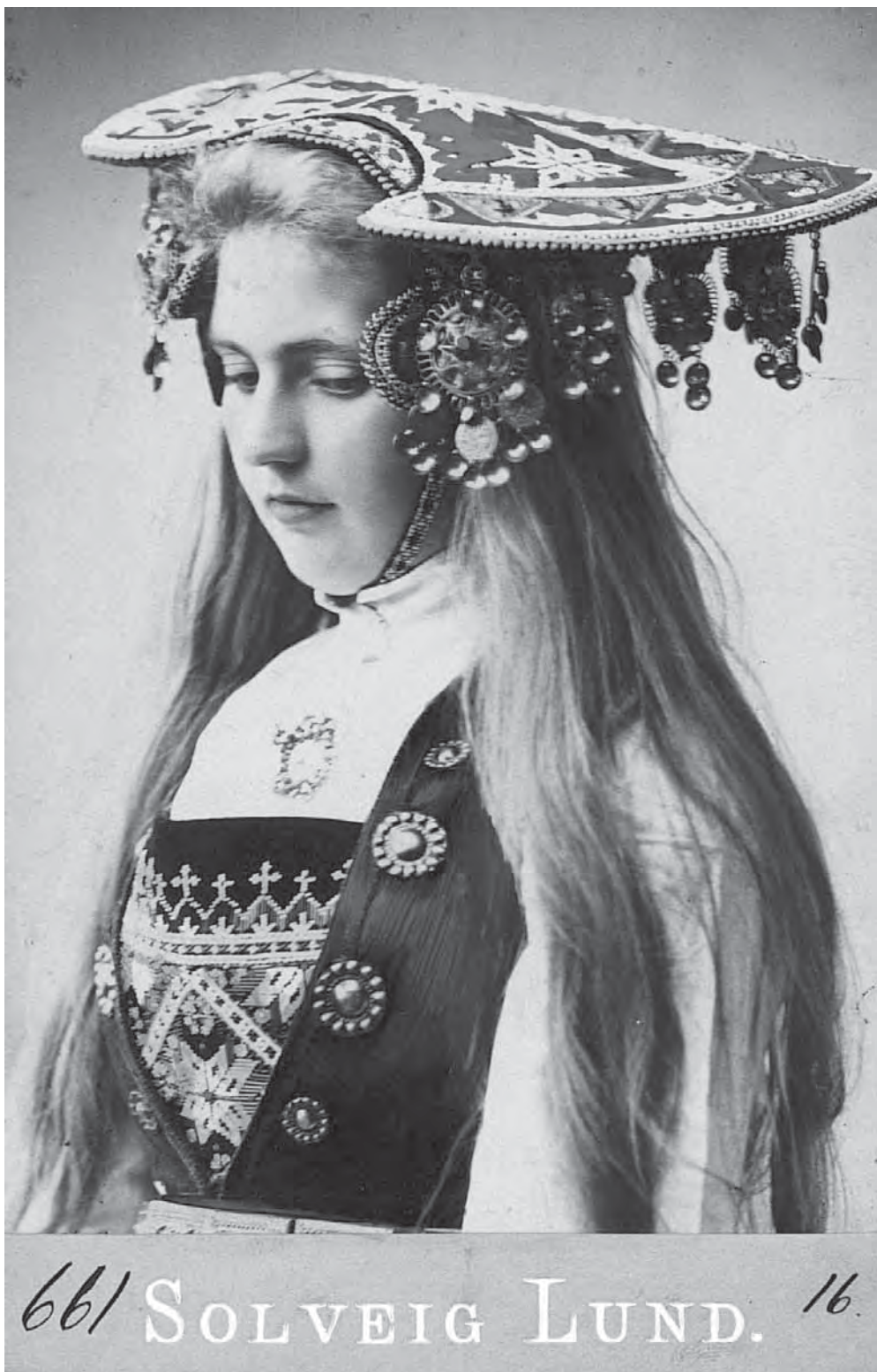
Рис. 8. Костюм невесты. Провинция Фосс, Норвегия. 1902 г. МАЭ. Колл. № 661-16