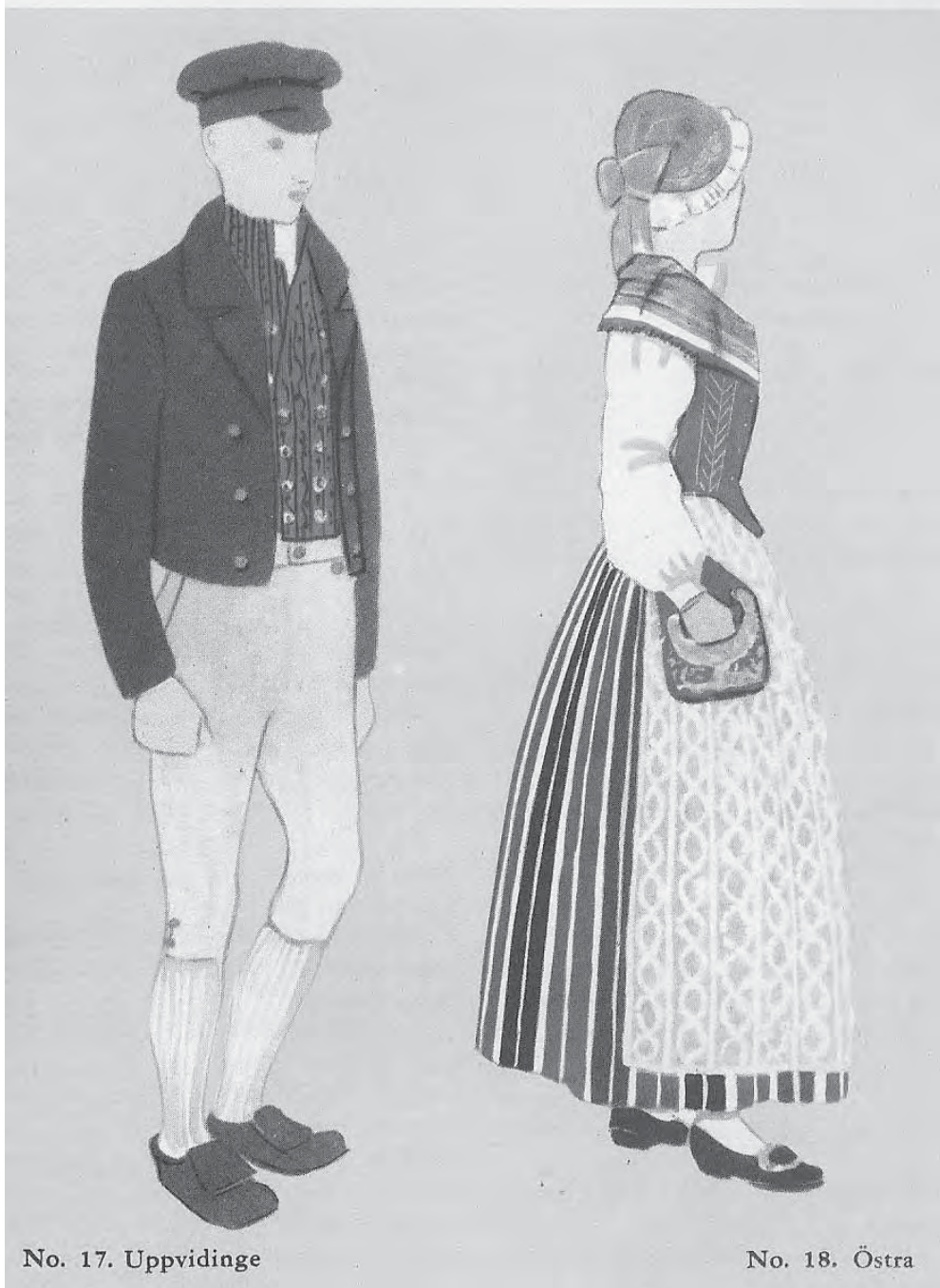
No. 17. Uppvidinge