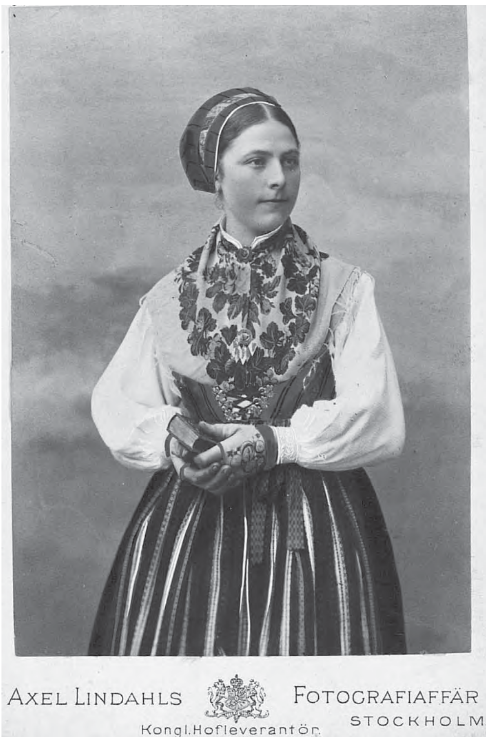
Рис. 4. Женский костюм, Leksand, провинция (Dalarna), Делакарлия, Швеция. 1902 г. МАЭ. Колл. № 661-10