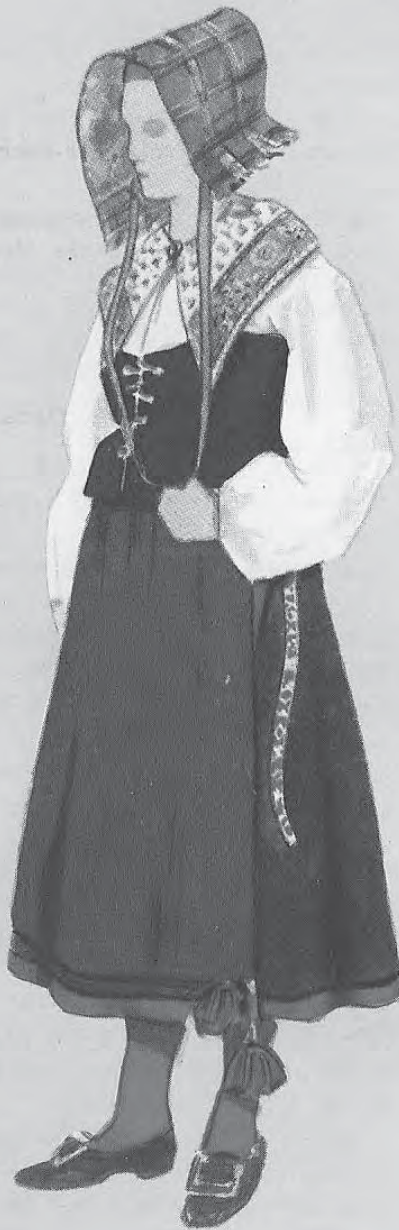
No. 45. Floda