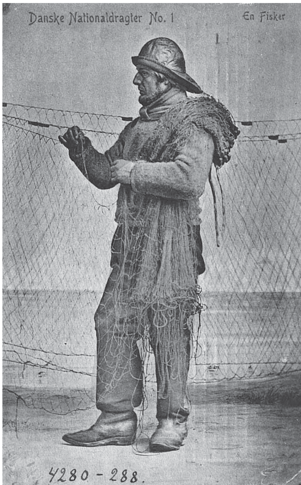
Рис. 13. Костюм рыбака. Фискер. Danske National dragter. En Fisker. МАЭ. Колл. № 4280-288. Открытка раскрашена