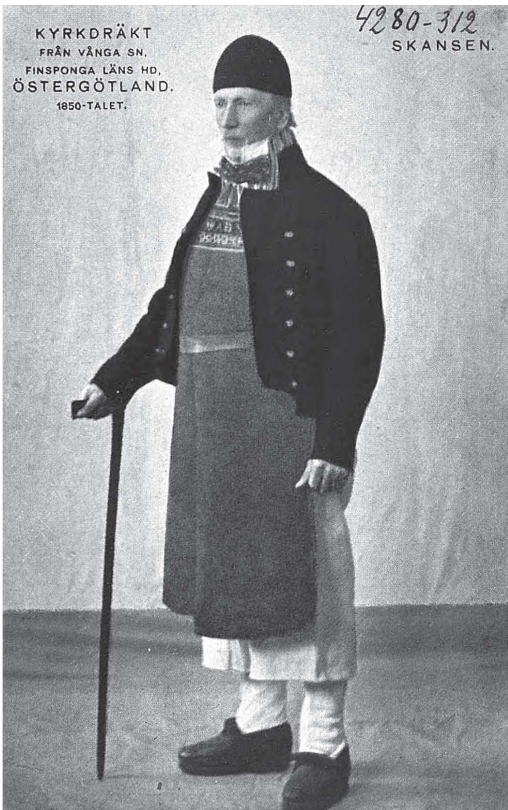
Рис. 20. Мужской костюм (вид спереди). Скansen. Эстерготланд. Kyrkdräkt från Vånga sn. Fiinsponga läns hd. Östergötland. 1850-talet. Skansen. МАЭ. Колл. № 4280-311. Открытка раскрашена