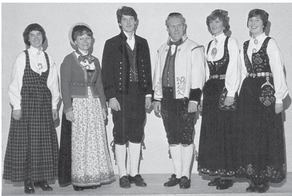
Рис. 25. Группа норвежцев в национальных костюмах из Ванг, Валдрес, провинция Оппланд