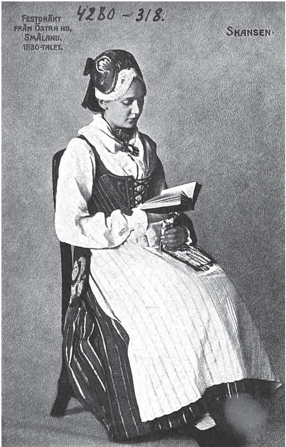
Рис. 16. Женский костюм. Скансен. Смоланд. Festdräkt från Ostra hd., Småland. 1830-talet. Skansen. МАЭ. Колл. № 4280-318. Открытка раскрашена