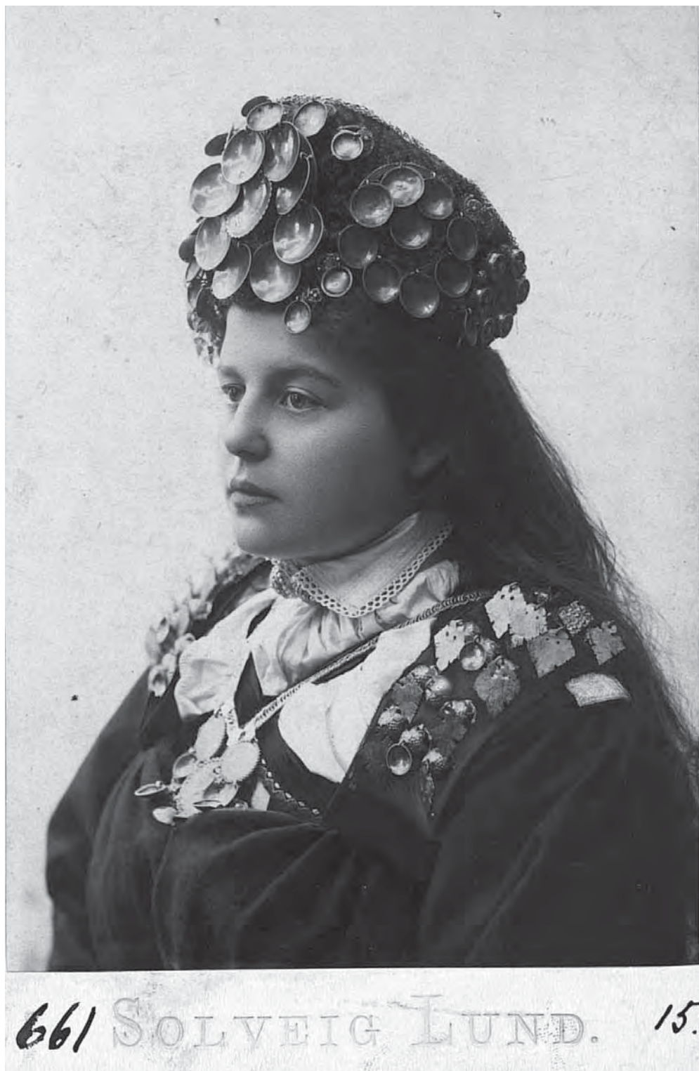
Рис. 7. Костюм невесты. Долина Сетерс, Норвегия. 1902 г. МАЭ. Колл. № 661-15