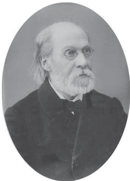
Рис. 3. Николай Петрович Вагнер (1829–1907)