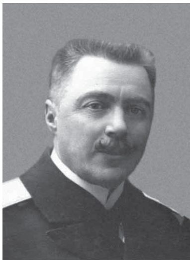
Рис. 5. Петр Николаевич Вагнер (1862–1932)

Наиболее полными сведениями мы располагаем о старшем сыне профессора зоологии Николая Петровича Вагнера, Петре Николаевиче Вагнере, родившемся 10 мая