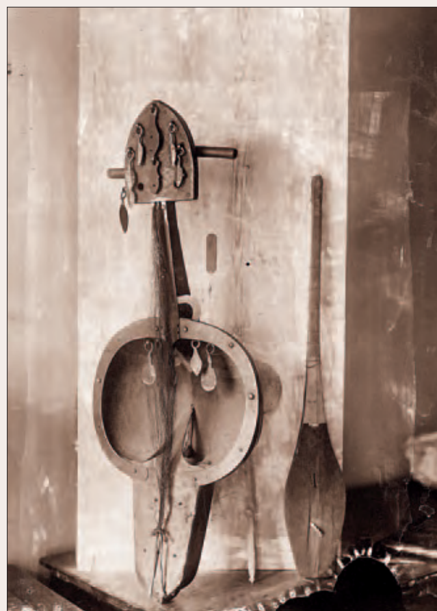
Рис. 3. С. М. Дудин. Музыкальные инструменты кобыз и домбра. Фотоотпечаток, 17,0 × 23,0 см. 1899 г. МАЭ РАН, № 1199–284

Рихард Карутц, впоследствии ставший одним из основателей и пропагандистов нацистской расовой теории 8 , несомненно, талантливо и с немецкой тщательностью описал свое путешествие на Мангышлак, и есть основание думать, что в книге сохранилось описание одного из моментов записи, о которой идет речь: «Иногда какой-нибудь певец снимает со стены двухструнную домбру (рис. 3), берет простые монотонные аккорды и поет о любви и жизни, о людях, повидавших свет, о домоседах и т. д. К тихим звукам примешивается многообещающий бас пискека, которым хозяйка усердно перебалтывает кумыс для вечера. В полутьме кибитки сверкают белые как снег зубы и веселые глаза, к хозяину жметя его любимый сынок, которому в честь редкого гостя разрешено дольше оставаться на ногах и послушать певца, от которого не отрывается его взор, пока, усталый, он не свалится на колени отца и тот не прикроет его осторожно теплым одеялом (рис. 4–5). Над открытым куполом кибитки сверкают уже звезды на вечернем небе, перед дверью вспыхивают еще красные языки догорающего очага, освещая мелькающие халаты, вдали раздается короткий резкий лай собаки. Один за другим встают и оставляют кибитку киргизы; темнота и тишина степной ночи окутывают кибитку и аул, пока с рассветом не встанут женщины и не раздуют снова тлеющего огня» 9 .