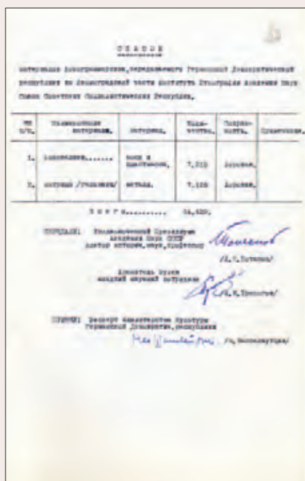
Рис. 2. Приложение к Акту передачи коллекций Берлинского фонограммархива Министерству культуры ГДР от 19.11.1958. Архив МАЭ РАН, ф. К-IV, оп. 15, д. 6, л. 82