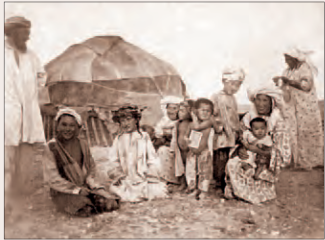
Рис. 5. Р. Карутц. Многочисленность киргизской семьи. 1903–1909. Там же. Таб. 20

Помимо копий материалов Берлинского фонограммархива в Институте русской литературы (Пушкинский Дом) РАН хранится коллекция валиков с записями казахского фольклора, осуществленных в 1920 и 1930-е гг., и богатое собрание грампластинок, выпущенных в советские годы. Все эти интереснейшие материалы, как и записи Рихарда Карутца, самые ранние из существующих записей казахского фольклора, еще ждут своего исследователя.