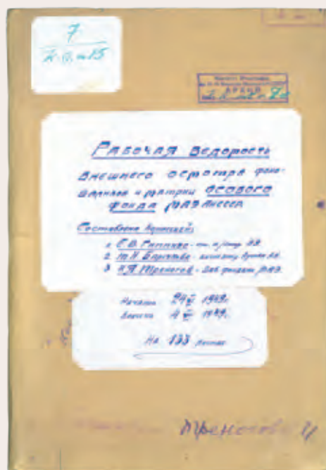
Рис. 1. Обложка «Рабочей ведомости внешнего осмотра фоноваликов и матриц Особого фонда МАЭ АН СССР». 24.06.1949–04.07.1949 (133 листа). Архив МАЭ РАН, ф. К–IV, оп. 15, д. 7