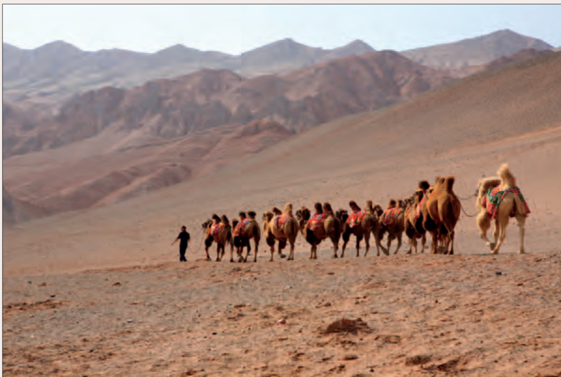
Рис. 2. Караван в пустыне Такла-Макан. Экспедиция МАЭ РАН, 2008 г.