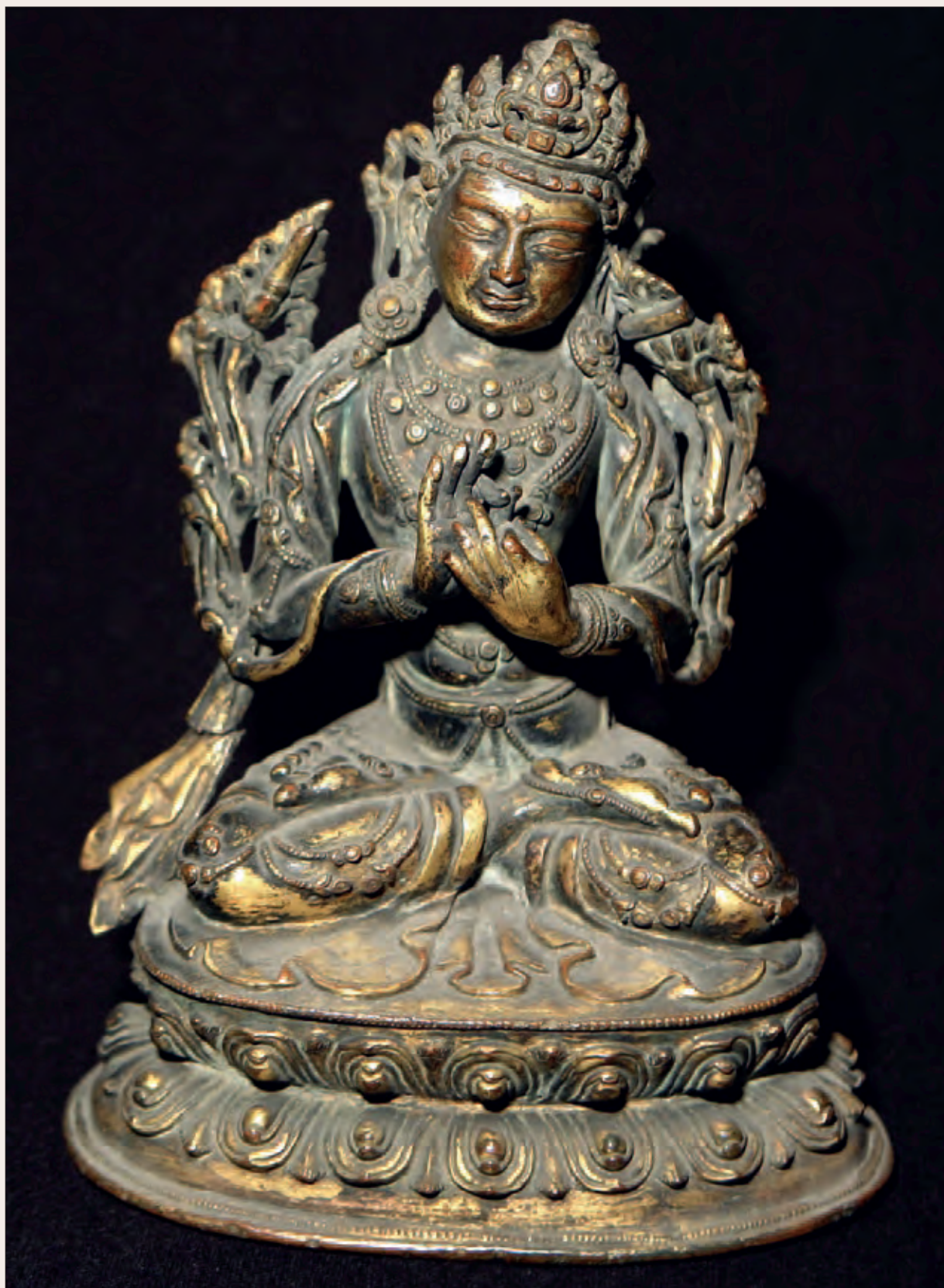
Рис. 5. Статуэтка Манджушри. Высота 17,0 см. Бронза. Дар С. Н. Алфераки, 1899 г. МАЭ РАН, № 455-1.