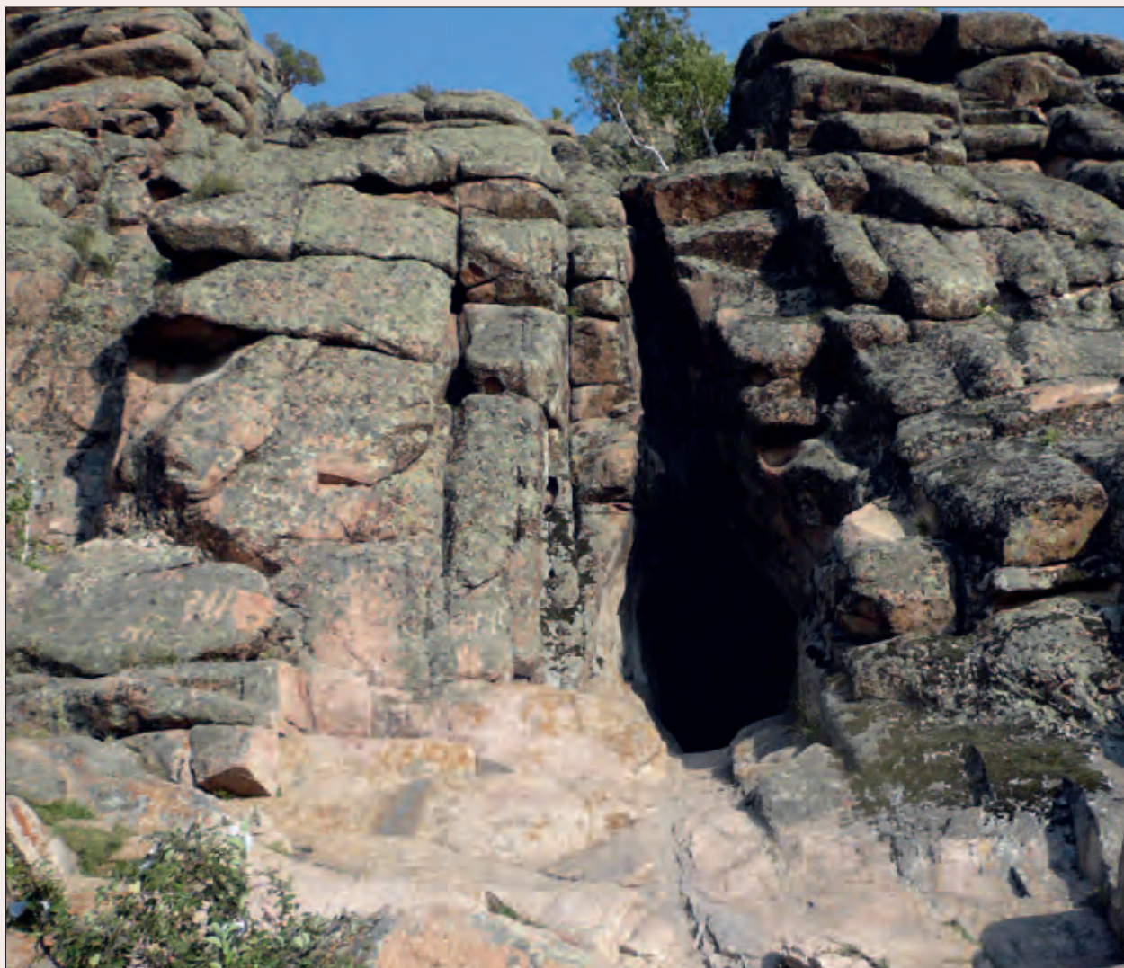
Рис. 3. Вход в пещеру Аулие-Тас (Коныр аулие). Экспедиция МАЭ РАН, 2010 г.

лежит около Баян-аула, близ Павлодаро-Баянаульско-Каркаралинского тракта. Вторая — на Сергиопольском тракте, в той его части, которая ведет от Семипалатинска до Чугучака (через Аягуз).