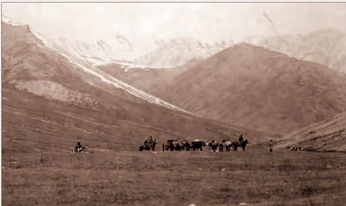
Рис. 1. Перевал Таш-Рабат по пути из Нарына к озеру Чагыр-куль. Фотоотпечаток, 13,0 × 18,0 см. Поступление 1899 г. Собиратель Н. Ф. Петровский. МАЭ РАН, № 511–8