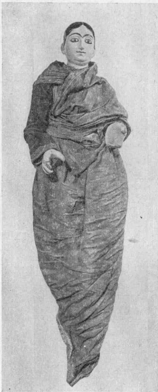
Рис. 7. Жена царя Дашаратхи, № 3065-13.

360 жен. Трудно сказать, которая из них участвует в представлении. Скорее всего, это должна быть либо Каушалья — мать Рамы, либо Кайкейя, интриги которой вынудили Раму уйти в 14-летнее изгнание, оставив престол сыну Кайкейи Бхарате. Описываемая кукла могла с равным успехом