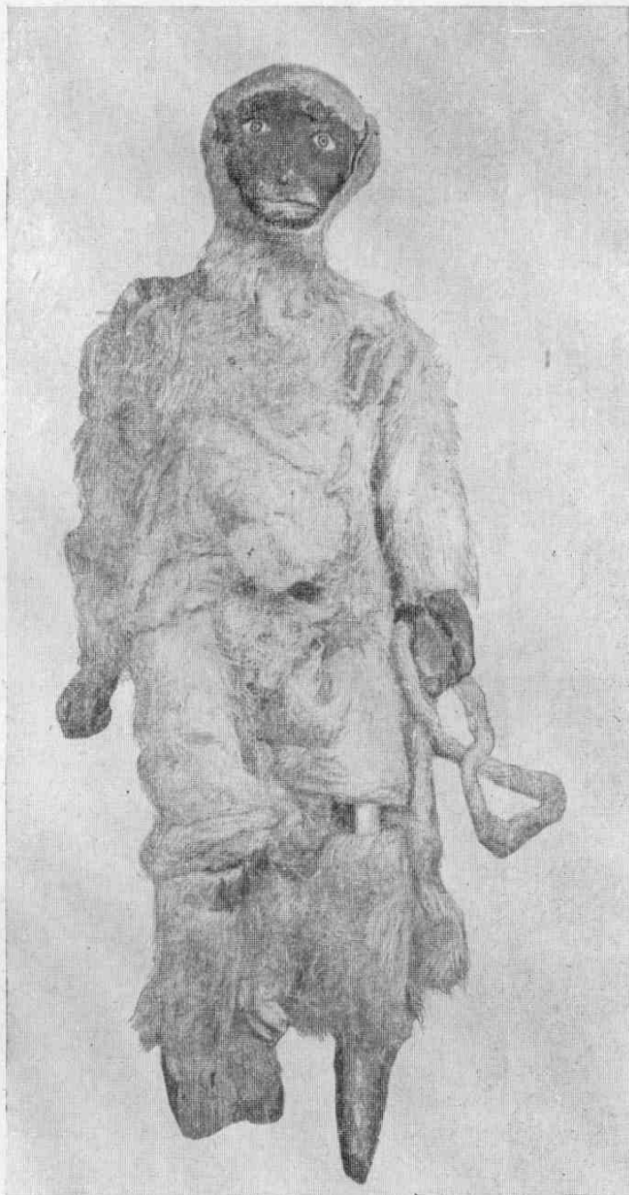
Рис. 4. Хануман, № 3065-9.