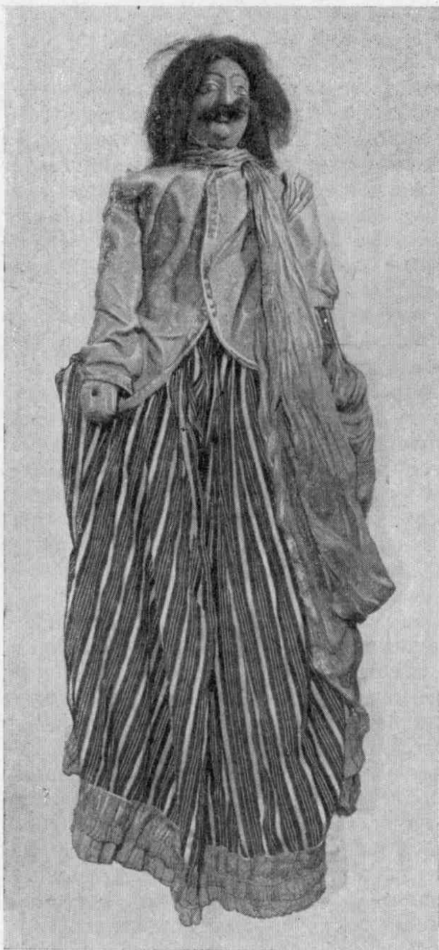
Рис. 1. Рама, № 3065-1.

скрытый от зрителя, держит сверху веревки, заставляющие двигаться руки. Некоторые куклы, например, та, которая изображает Равану, требуют для своего управления даже большего количества людей. Текст, выражающий или поясняющий действие, произносит либо один из кукловодов, либо специальный чтец или певец. Свойственная индийскому искусству традиционность дает себя знать и в этом театре. Она сказывается и в выборе сюжета, и в его трактовке, и в тех выразительных средствах, которые привлекаются для характеристики отдельных персонажей.