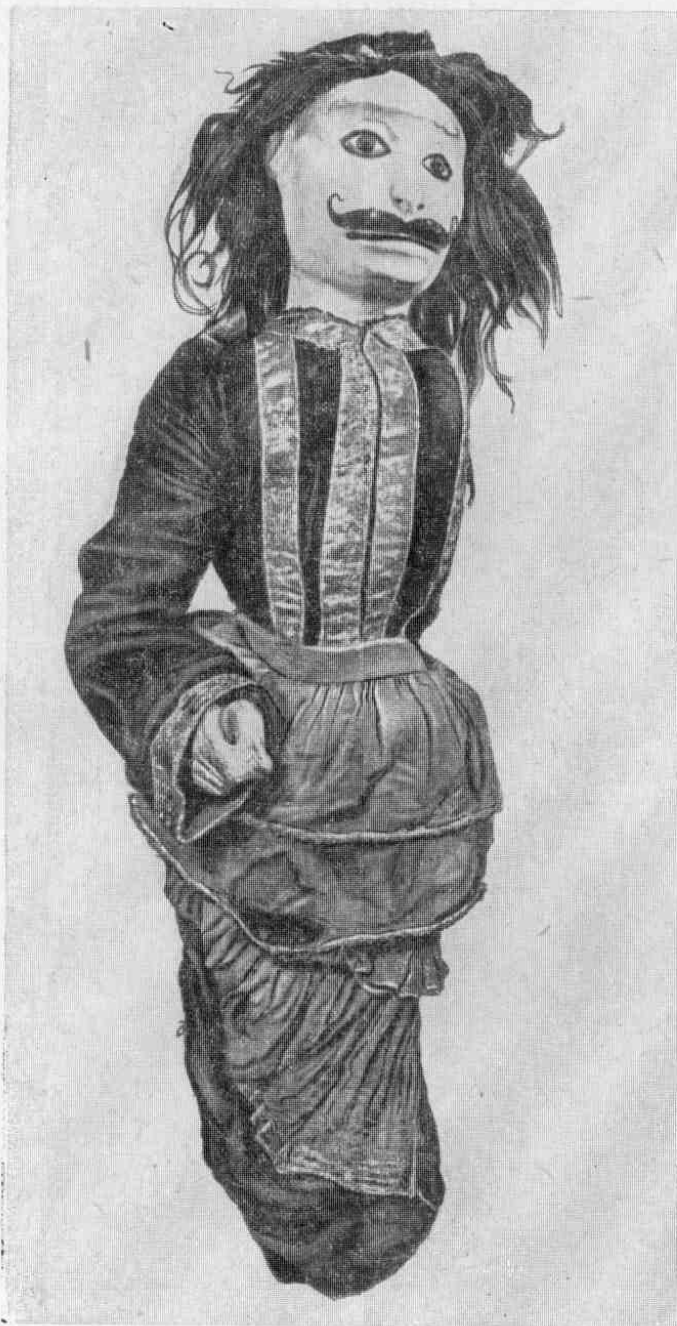
Рис. 5. Бали, № 3065-5.

В исполнении деревянных актеров мы видим еще трех обезьян: Бали (№ 3065-5), царя обезьян, некогда похитившего престол Кишкиндхи у Сугривы и убитого Рамой (рис. 5); Сугриву (№ 3065-6), союзника Рамы,