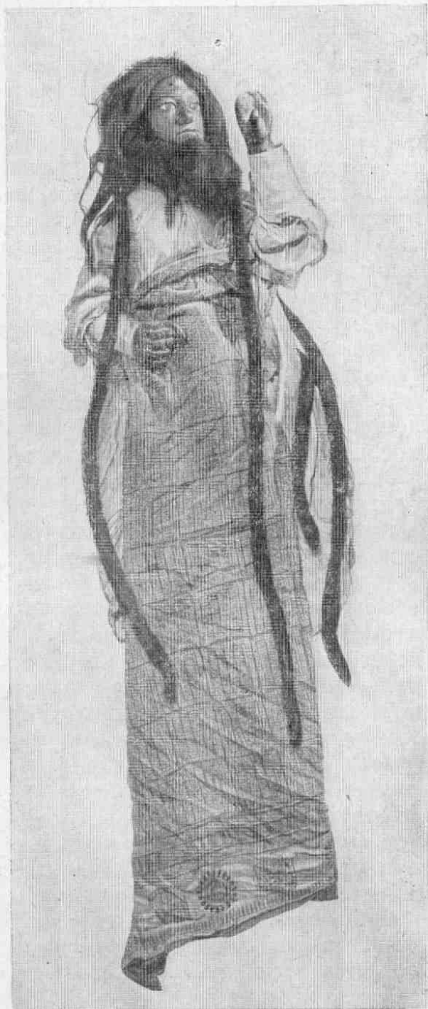
Рис. 3. Равана в виде отшельника, № 3065-7.

Подобным же путем достигается увеличение числа рук Раваны. Другая планка, меньшего размера (длиной 55 см и шириной 18 см), укрепляется с помощью веревок на спине куклы на уровне плеч. На каждом конце планки прибито по четыре руки длиной от 28 до 39 см, расходящиеся под углом. Прямые, выкрашенные в синий цвет руки изображены очень условно, пальцы на них сложены в кулак. Хотя голов у кукольного Раваны не десять, а девять, а рук вдвое меньше, чем требует легенда,