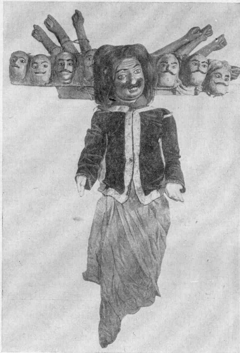
Рис. 2. Равана в виде воина, № 3065-2.

Начнем с первого аспекта Раваны. Когда в эпосе речь идет о Раване, он обычно сравнивается с горой из сажи; 8 тем самым подчеркиваются его огромные размеры и черный цвет лица. В бенгальском театре Равану изображает одна из самых крупных кукол (ее высота 69 см), но цвет его — не черный, как следовало бы по эпосу, и не белый, как нередко изображается Равана во время борьбы с темнокожим Рамой,