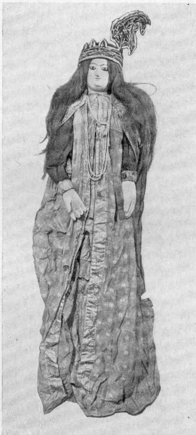
Рис. 6. Сита, № 3065-11.

Кроме молодой царицы, в театре кукол представлена и старая: это одна из жен царя Дашаратхи, отца Рамы (№ 3065-13), которая по ходу действия становится вдовой (рис. 7). По преданию, у царя Дашаратхи было