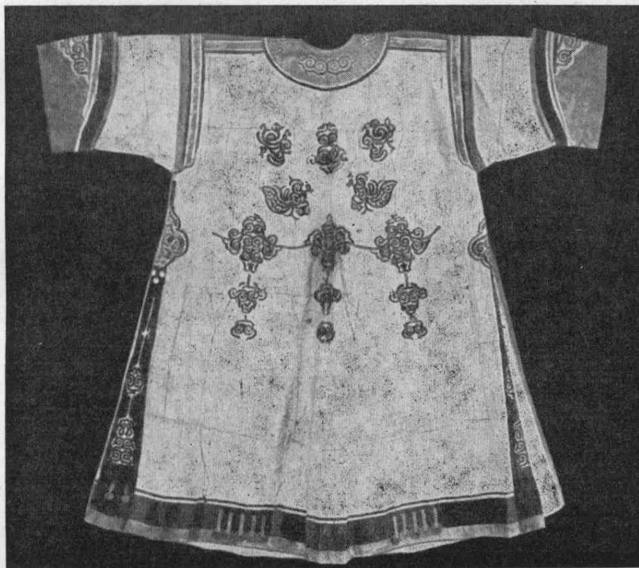
Рис. 1. Женский халат из рыбьей кожи. Вид сзади (№ 344-3/8).

ками (желтой и красной). Сзади полоса орнаментирована ажурным (прорезным) узором, пристроченным сухожильными нитками, окрашенными в красный и белый цвет, к подкладке из белой рыбьей кожи, нашитой вместе с орнаментированной полосой способом аппликации из материала халата. Центральная часть спины украшена сложным драконовидным узором и отдельными симметрично расположенными медальончиками; узор вырезан из рыбьей кожи, окрашенной в синий цвет, и пришит красными и белыми сухожильными нитками на тонкую рыбу