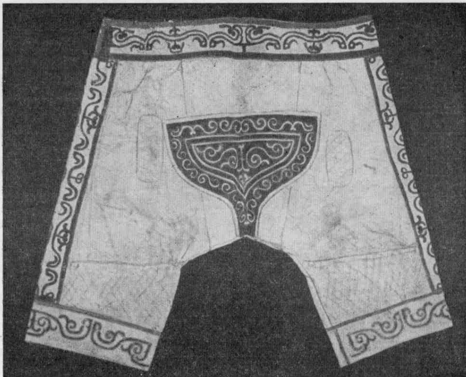
Рис. 2. Женские штаны из рыбьей кожи (№ 1765-190).

хранящихся в МАЭ, богато украшены орнаментом и халаты, привезенные в начале XX в. (№ 5821-2—4, № 1704, № 5164-3). Р. Мааком привезен и нивхский халат из рыбьей кожи (№ 344-3/8, № 3). Сравнивая нивхский халат с ульчским и нанайским, видим, что первый украшен скромно и на нем нет драконообразных изображений и родовых деревьев. Обычно нивхские халаты украшены орнаментом из цветных ниток — сухожилий или рыбьих кож, а также нашитыми украшениями из фигурно вырезанных и орнаментированных кож рыб в технике ап-