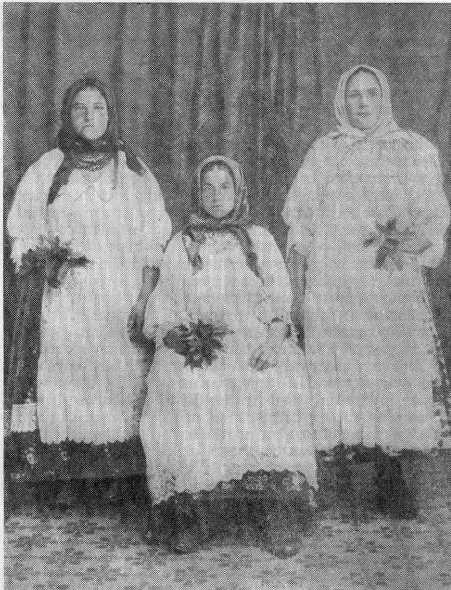
Рис. 4. Девушки из с. Шамордино Перемышльского у. Калужской губ. в праздничных нарядах. ГМЭ, № 528 «ил».

камень, а кукушке не клали», надевали рубашку, сарафан, пояс, платок, «фартука не надевают, так как эта фигура должна означать покойницу, а в фартуках не хоронят». Обряжание кукушки в районах с развитым обрядом сопровождалось причитаниями. 21 Антропоморфную кукушку укладывали в гроб, либо специально изготовленный и по тем вре-