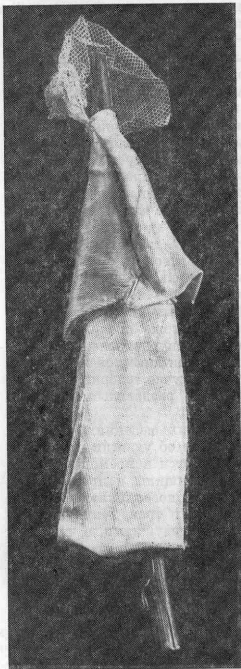
Рис. 3. «Кукушка» в подвенечном уборе.

О серьезности, тайности обряда с кукушкой говорят все подробные источники: мужчины, в первую очередь парни, не должны были присутствовать при нем и знать о месте «крещения» и захоронения кукушки. «Девушки, прежде чем приступить к выносу (кукушки, — Т. Б.), высматривали, свободен ли путь... Возвращались, если издали видели парня. Шли же обыкновенно задворками, избегая встреч»; «отношение крестьянок к обряду самое серьезное, его старательно скрывают, обставляя большой таинственностью». 12 Поэтому сведения о совместном исполнении обряда девушками и парнями или «всеми желающими» отражают результат деформации обряда, о чем говорят и конкретные факты: в некоторых южных местностях Орловской губ. и в Новосильском у. Тульской губ., где девушки и парни «крестили кукушку», никаких обрядовых действий, даже кумления, уже не существовало, а молодежь просто водила хороводы, «скакала» и пела песни. И, наконец, в Карачевском у. Орловской губ., по утверждению В. Добровольского, «крестили кукушку» мальчики (услышав первый раз ее кукованье), т. е. менялись крестами и таким образом братались. 13