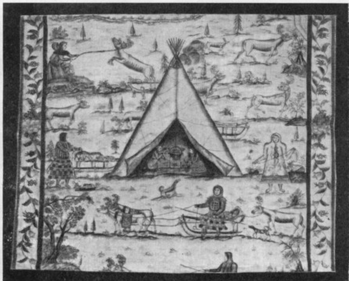
Рис. 1. Рисунок акварелью на ткани (№ 5753-3).