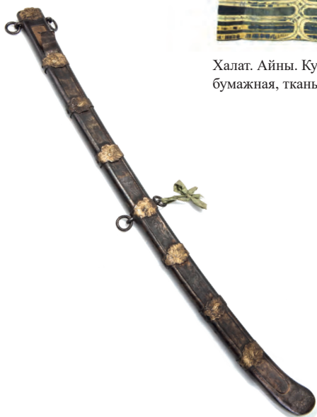
Портупея с ножнами. Приобретена у айнов Курильских островов. XVIII в. Дерево, ткань шелковая, ткань из растительного волокна. МАЭ № 820-4