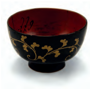
Чашечка для сакэ. Япония. XVIII в. Дерево, лак. Подношение капитана Дайкокуя Кодаю императрице Екатерине II. МАЭ № 6711-1