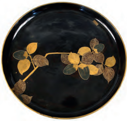
Подносы. Япония. XVIII в. Дерево, лак, фольга золотая, фольга серебряная. Из экспедиции А. Лаксмана в Японию. МАЭ № 677-6; 677-7