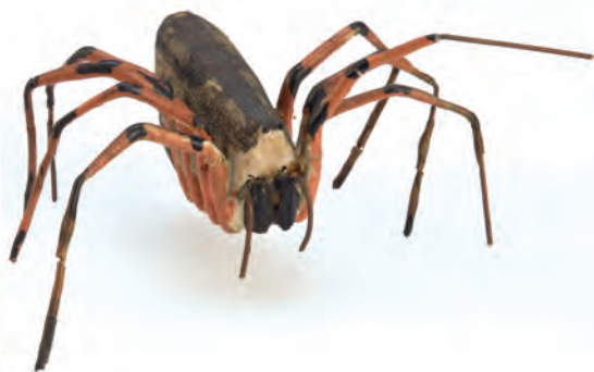
Муляжи насекомых и членистоногих (фрагмент). Япония. XVIII в. Дерево, грунт, лак, краска, проволока медная, бумага, волос конский. Из коллекции А. Штуцера. МАЭ № 677-32