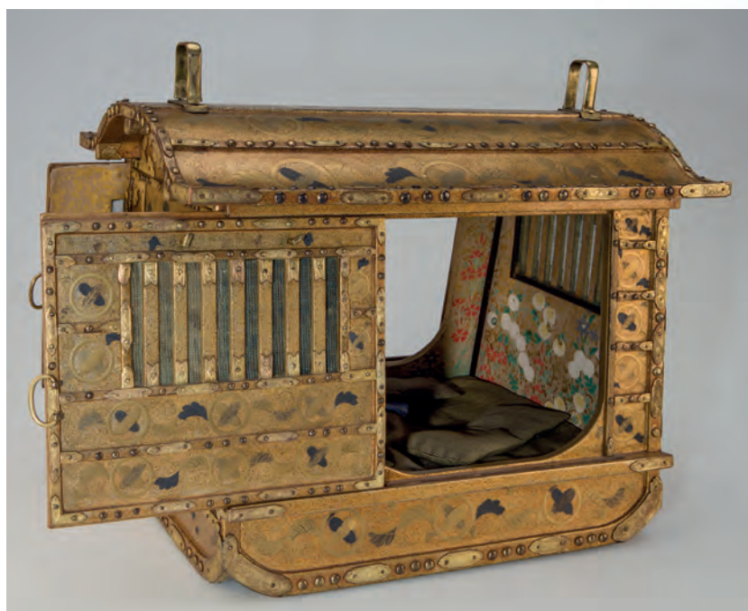
Макет традиционного японского паланкина для знатных особ. Япония. XVIII в. Дерево, ткань шелковая, папье-маше, лак, бронза. Из коллекции А. Штуцера. МАЭ № 677-17abcd