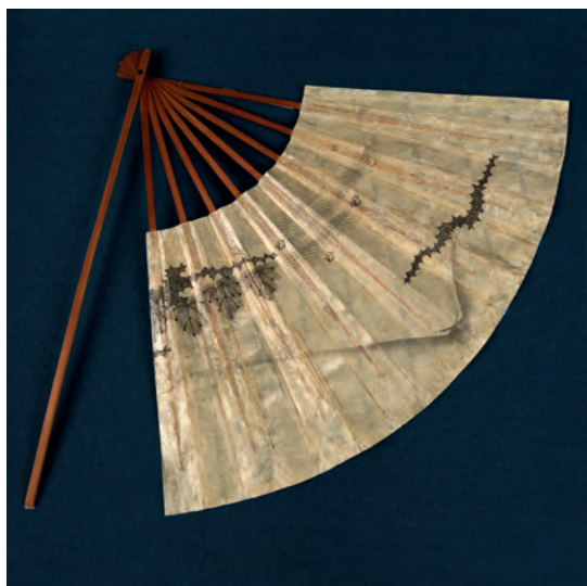
Веер «оги». Япония. XVIII в. Бамбук, бумага вошенная, дерево, краска, медь. Подношение капитана Дайкокуя Кодая императрице Екатерине II. МАЭ № 677-3