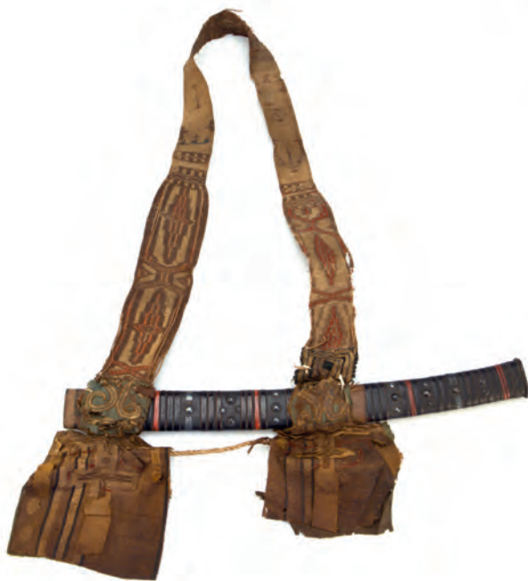
Ножны сабельные. Приобретены у айнов Курильских островов. Дерево, металл, ткань шелковая. XVIII в. МАЭ № 820-1