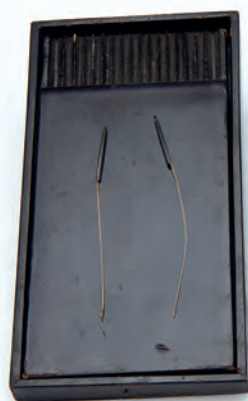
Набор для иглоукалывания. Япония. XVIII в. Дерево, лак, фольга золотая, серебро. Из коллекции А. Штуцера. МАЭ № 677-26