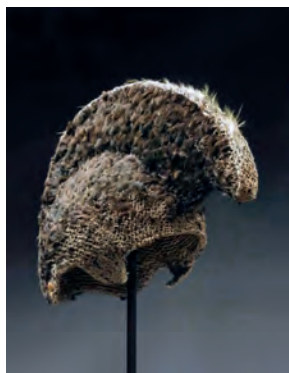
Шлем. Гавайские острова. XVIII в. Перо, волокно растительное. Из экспедиции Джеймса Кука. МАЭ № 505-7