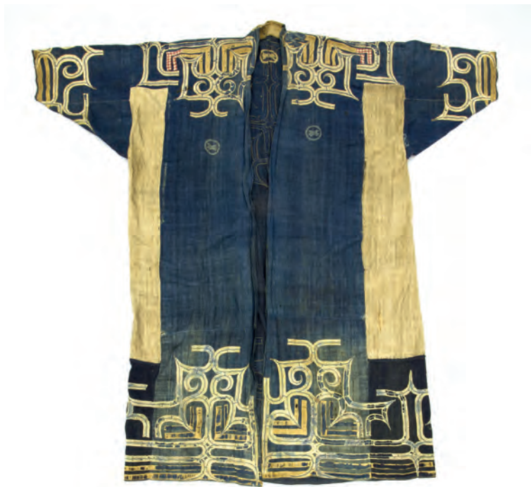
Халат. Айны. Курильские острова. XVIII в. Даба хлопчато-бумажная, ткань шелковая. МАЭ № 820-7/2