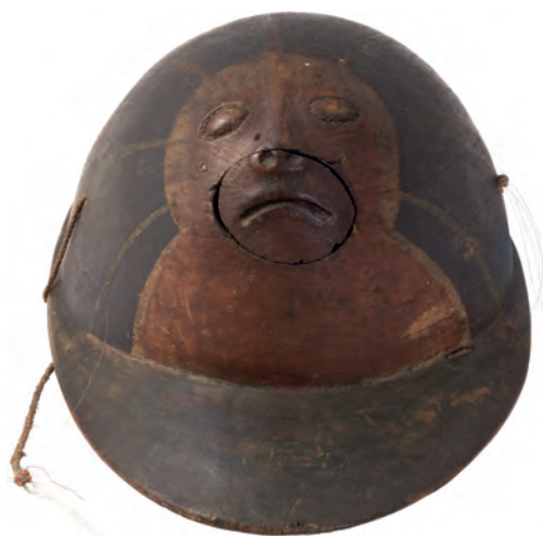
Шляпа охотничья. Аляска, о-в Кадьяк. XVIII в. Дерево, краска, волос оленя, кожа нерпы, китовый ус, сухожилия. Из Северо-восточной географической и астрономической экспедиции под командованием капитан-лейтенанта И.И. Биллингса. МАЭ № 562-2