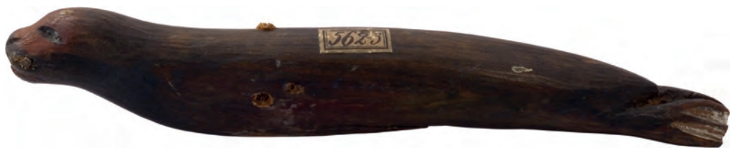
Фигурка морского льва, символизирующая духа-хранителя морских животных. Аляска, о-в Кадьяк. XVIII в. Дерево, краска, ус морского льва. Из Северо-восточной географической и астрономической экспедиции под командованием капитан-лейтенанта И.И. Биллингса. МАЭ № 562-3