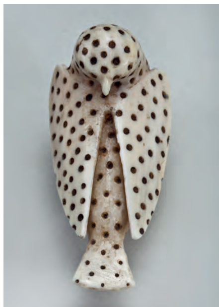
Фигурка птицы. Алеутские острова. XVIII в. Моржовый клык, краска. Из Северо-восточной географической и астрономической экспедиции под командованием капитан-лейтенанта И.И. Биллингса. МАЭ № 2937-4