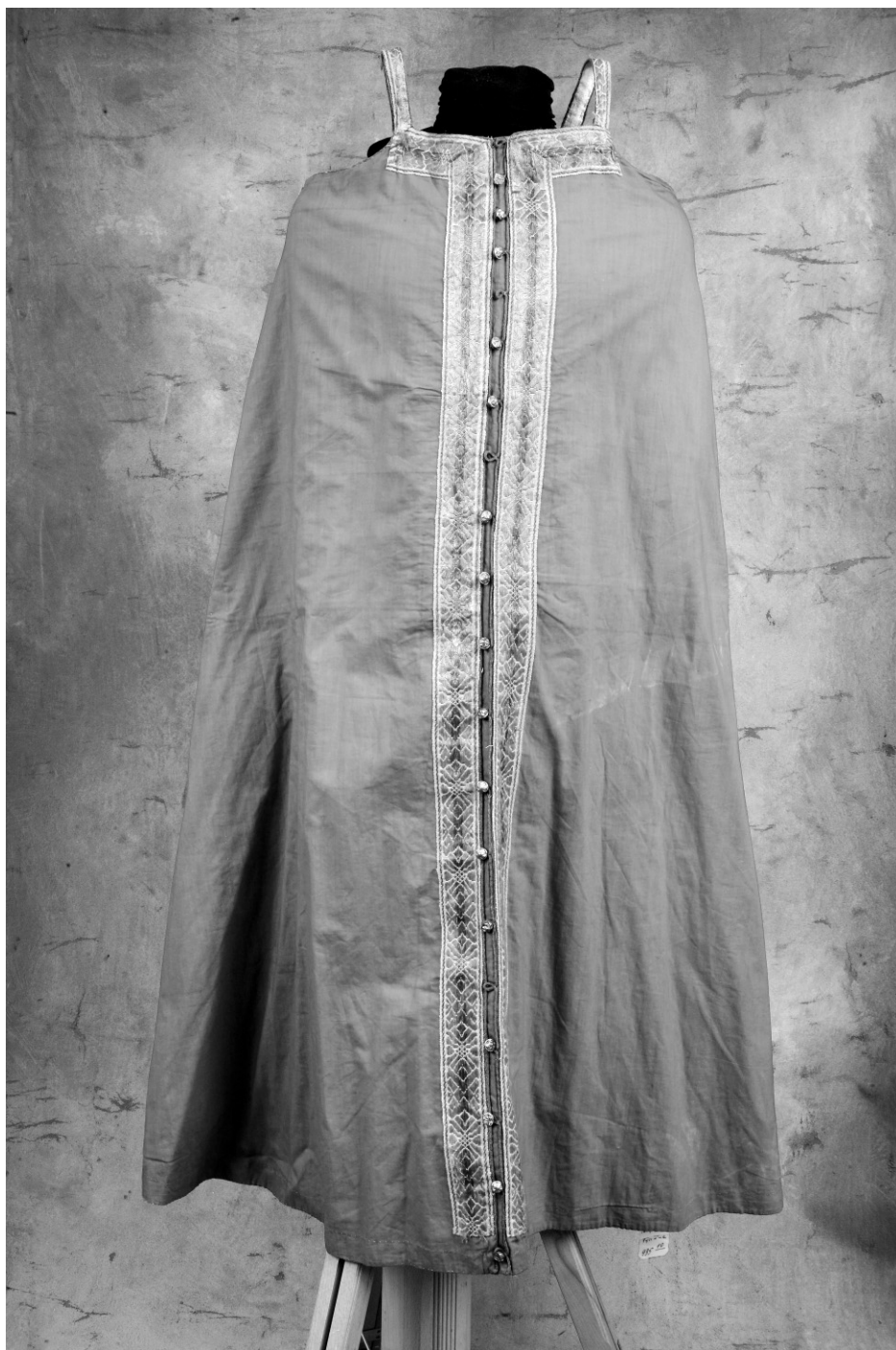
Рис. 1. Сарафан. МАЭ. Колл. № 935–10.