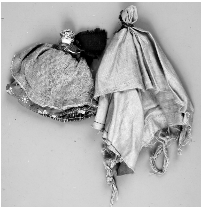
Рис. 6. Куклы. МАЭ. Колл. № 1036–53, 1036–59.

ном его изменении в сторону потепления в ближайшее время. Это стало дополнительным аргументом в пользу его гипотезы о возможном широком сельскохозяйственном освоении Крайнего Севера в самое ближайшее время исходя из цикличности изменения климата.