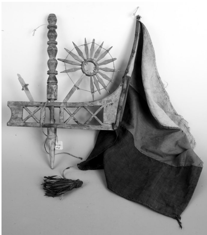
Рис. 5. Флюгер. МАЭ. Колл. № 1036–190.