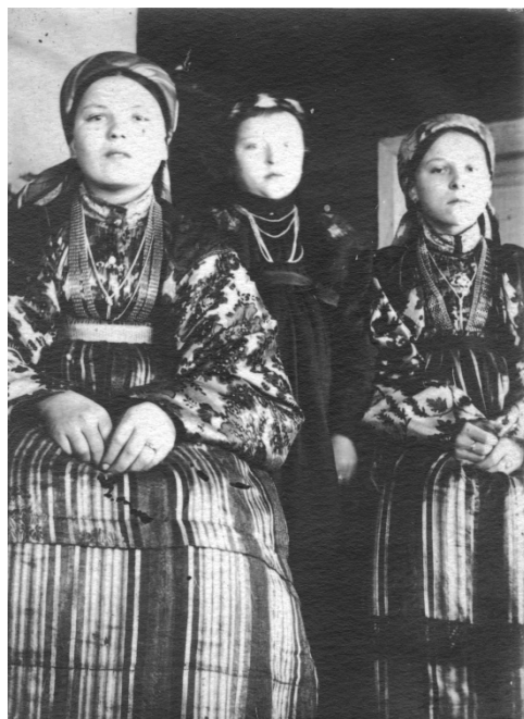
Рис. 3. Жительницы с. Усть-Цильма.