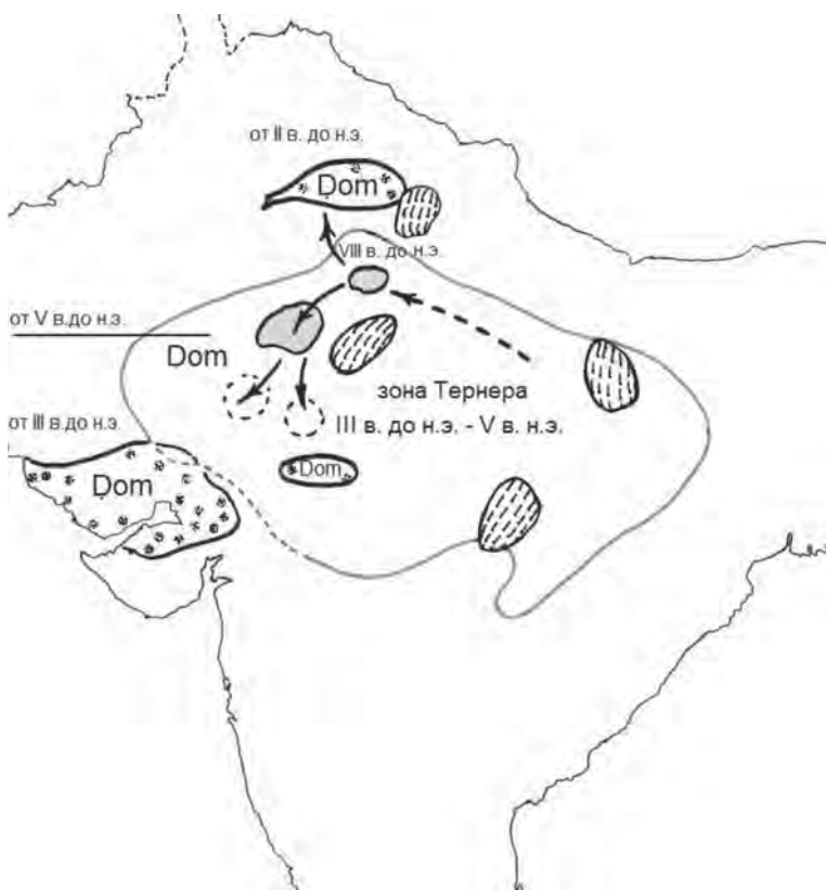
Карта 2. Совмещение константных данных о проторомах в ареалах зоны Тернера (Центральная Индия и Северный Панджаб)

Серым цветом обозначены области расселения союза племен шальва, часть которого составляли носители самоназвания dom/domba в древности, начиная с VIII–VI вв. до н.э.