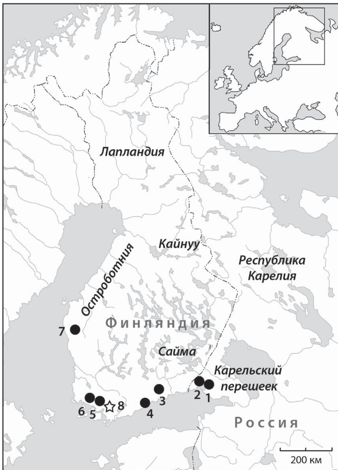
Рис. 1. Места, упомянутые в тексте. Номера 1–7 указывают на районы, использовавшиеся в исследовании Эйряя: 1 — Выборг, 2 — Саккиярви, 3 — Лапинярви, 4 — Эспоо, 5 — Паимио, 6 — Маариа (в настоящее время Турку), 7 — Теува; номер 8 указывает расположение эпонимного памятника Уске-ла (в настоящее время — Сало)