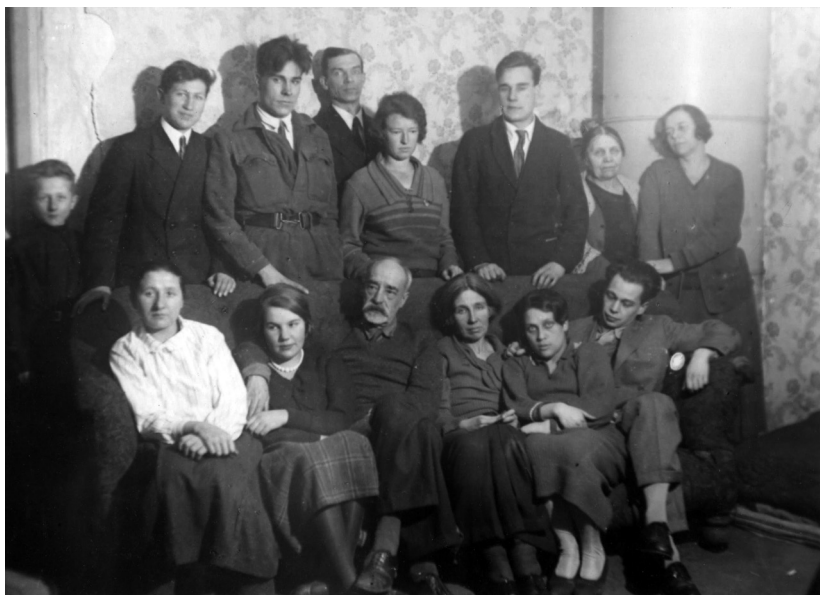
Рис. 4. Перед ссылкой.