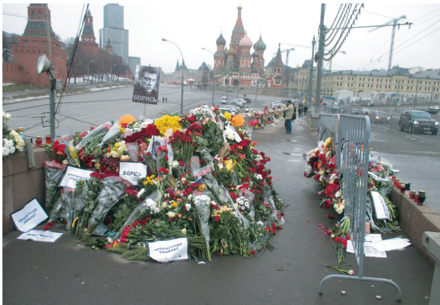
Ил. 1. Центральная часть мемориала 2 марта 2015 г. Видно продолжение мемориала до окончания моста.