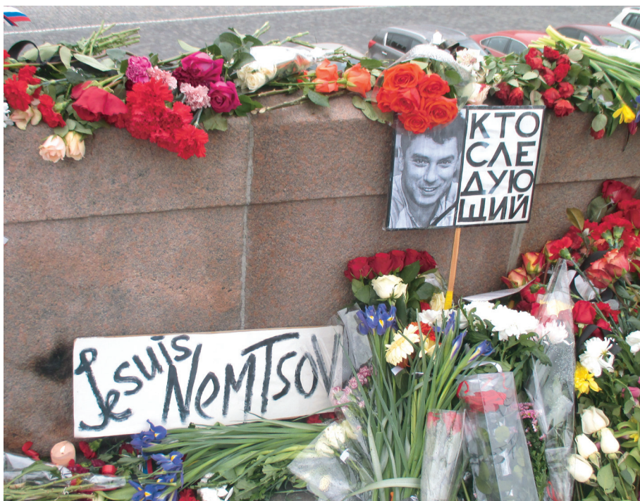
Ил. 2. Плакаты мемориального шествия с протестами против террора. 2 марта 2015 г.