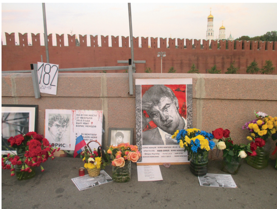
Ил. 4. Оформление центральной части мемориала 27 августа 2015 г.: табличка, указывающая количество дней после убийства; информационный плакат; российский флажок; букет расцветки украинского флага; портреты (в том числе работы Е. Хейдиз) и высказывания Б.Е. Немцова; стихи; лампы и т.д.